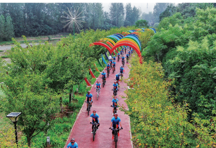
骑行爱好者在天河绿道上骑行。

“以天为幕,以城为景。千架无人机表演形式取代传统烟花表演,不仅环保,而且科技感十足。”前不久,在2023年郧西天河七夕文化旅游节上,千架无人机表演《踏云飞行》,令现场观众叹为观止。 绿色办节,低碳发展。2023年郧西天河七夕文化旅游节19场系列活动突出“绿色低碳、田园生活”的办节理念,持续打响“天上七夕·人间郧西”“天子渡口·古寨上津”两大文旅品牌,推进节能、降碳、扩绿、增长,“绿色低碳七夕”已成为郧西天河七夕文化旅游节的亮丽底色。