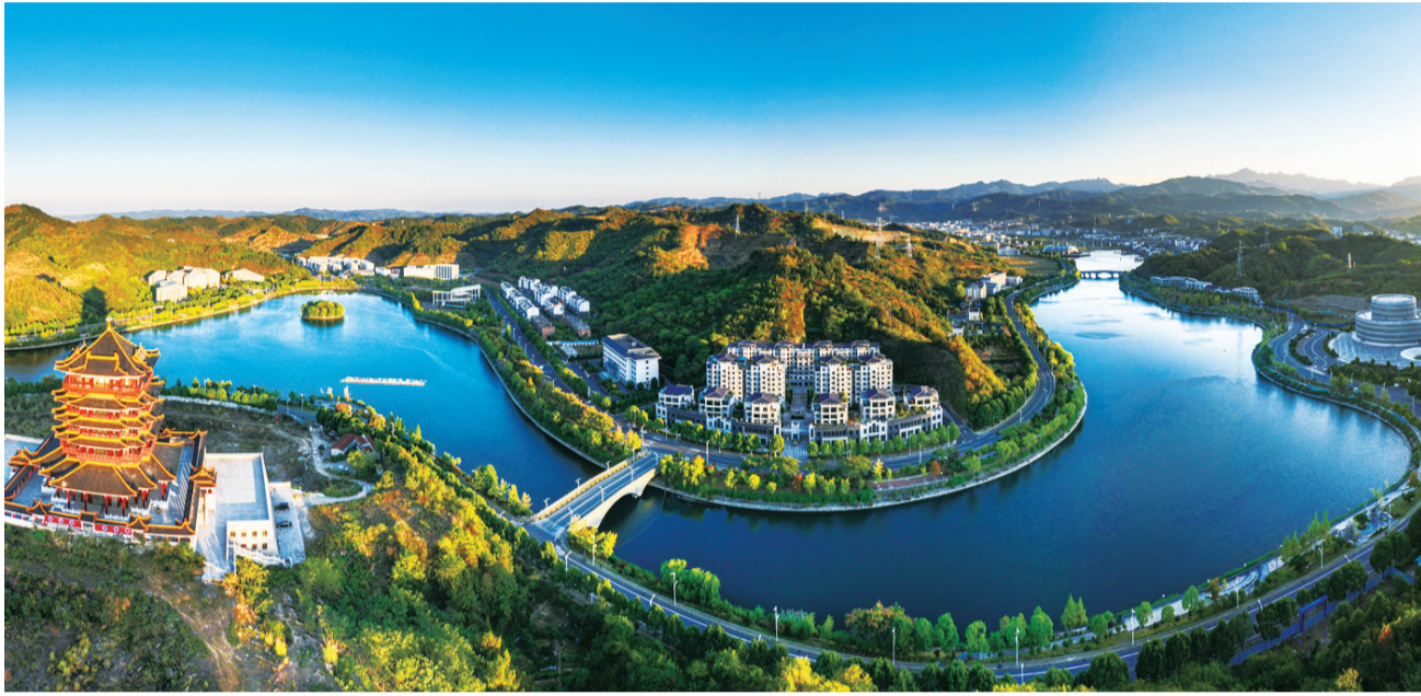
太极湖新区全景(资料图片)

“五里一庵十里宫,丹墙翠瓦望玲珑。楼台隐映金银气,林岫回环画境中。”400多年前,明朝诗人洪翼圣一首题为《武当山中杂咏》的诗,生动展现了武当山自然生态与人文景观高度统一的资源禀赋。 初秋时节,武当山金顶人头攒动,伴随着人群的欢呼声,太阳拨开云层,七彩霞光洒落,脚下云海升腾,远处剑河在群山中若隐若现,烟波浩渺的丹江口水库被朝阳染成金色。 作为全国“两山”实践创新基地,近年来,武当山旅游经济特区坚持以习近平生态文明思想为引领,牢固树立“两山”发展理念,将生态优势转化为绿色低碳发展动能,全力打造“祈福圣地、太极武当”旅游新IP,加快建设世界级文化旅游目的地,走出了一条生态优先、绿色发展的特色文旅之路。