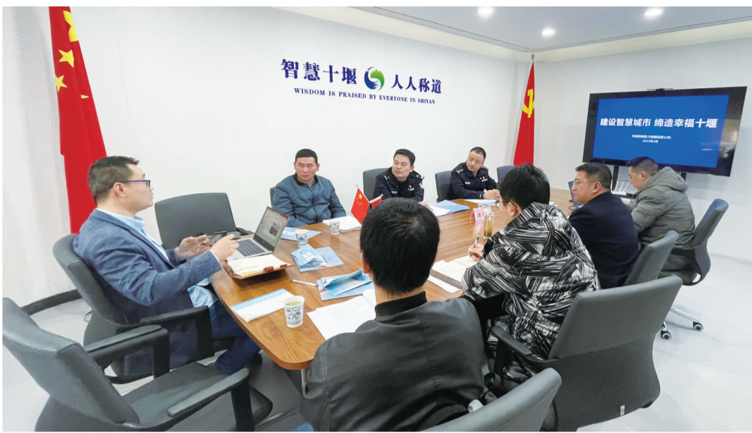
举办“武当云”网络安全座谈会