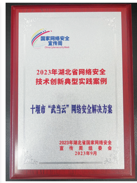
“十堰市‘武当云’网络安全解决方案”获表扬

9月11日,2023年湖北省国家网络安全宣传周启动仪式暨湖北省网络文明大会在黄石举行。会上,由十堰市政务服务和大数据管理局、市大数据中心支持,十堰城控集团(十堰大数据运营有限公司)携手华为开发的“十堰市‘武当云’网络安全解决方案”获评2023年湖北省网络安全技术创新典型案例。