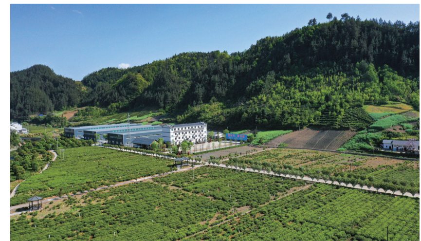
竹坪乡茶旅融合示范园

该乡党委政府一手抓产业发展,一手抓招商引资,党员干部切实当好服务企业的“后勤保障员”,帮助茶产业项目、企业解决“急难愁盼”问题,做好政策“加减法”,以一流营商环境助