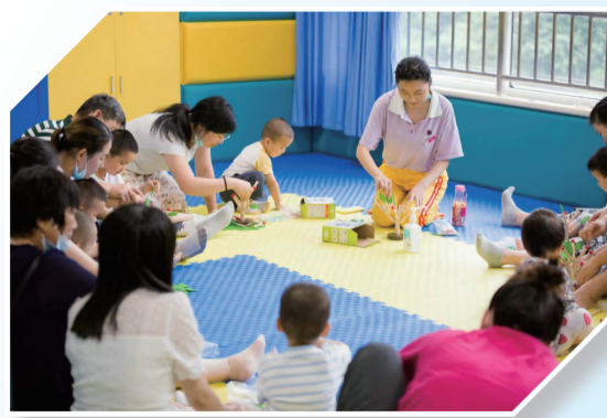
儿童康复科情景课