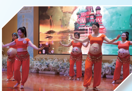
2023年第十五届车城孕妈趣味秀

打造全流程全生命周期健康体系，根本取决于就诊群体对医院的信赖与认可，尤其是医疗服务是否深入人心、打动人心。