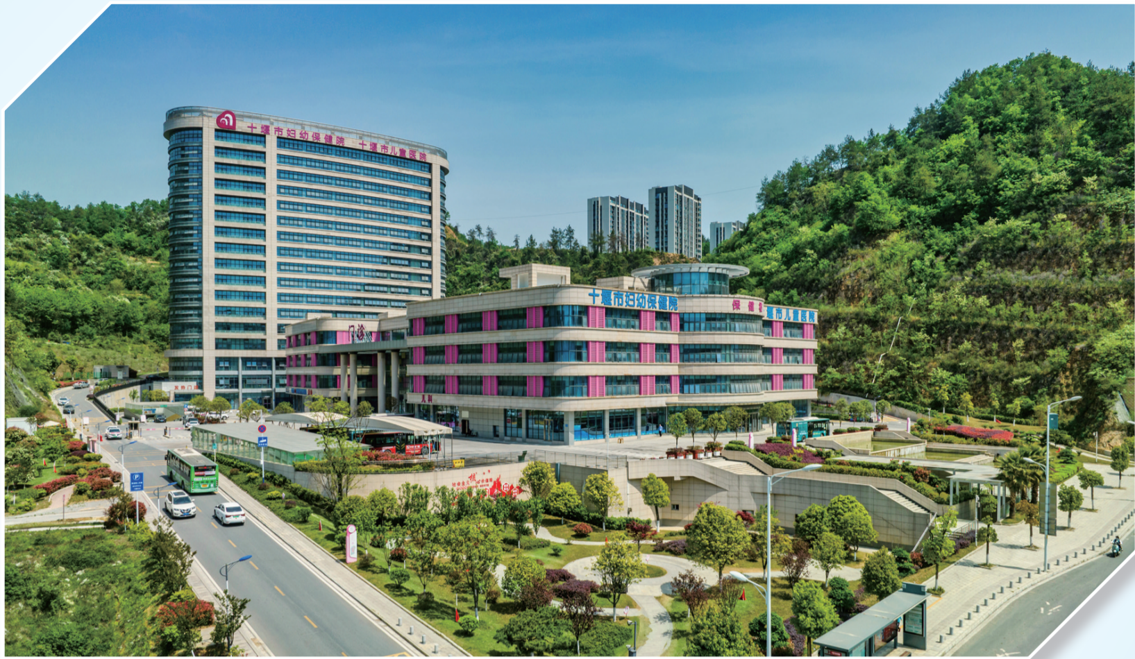
市妇幼保健院新院区

顺利降生、健康成长、快乐孕育、平安分娩、科学喂养、产后恢复……这些寄托女性希冀与美好期盼的词汇后面，承载着女性孕产期、更年期乃至老年期对整个生命过程的健康向往和追求。