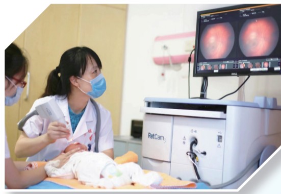
为病患儿做眼底筛查