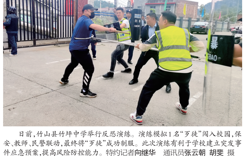
日前，竹山县竹坪中学举行反恐演练。演练模拟1名“歹徒”闯入校园，保安、教师、民警联动，最终将“歹徒”成功制服。此次演练有利于学校建立突发事件应急预案，提高风险防控能力。