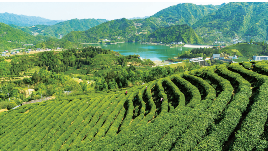
刘家山茶场,一垄垄茶树随山势起伏,层叠滴翠。

独具特色的品牌,研发多元茶产品,延伸产业链。”村里经过集体商议,确定了发展新思路。