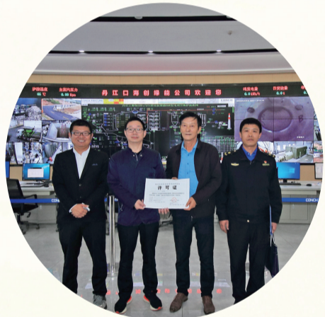
丹江口市城管执法局向海创生活垃圾焚烧发电厂发放城市生活垃圾经营性处置服务许可证