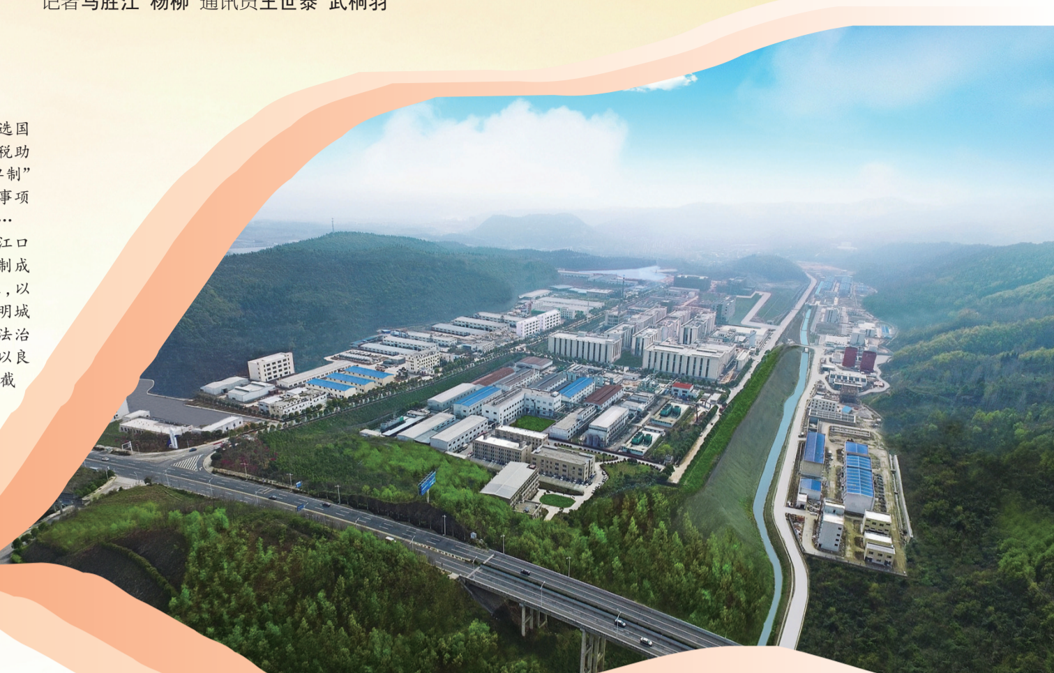
丹江口市生命健康产业园

今年以来，丹江口市委、市政府印发《丹江口市“营商环境改革年”活动实施方案》，以控制成本为核心，以市场主体满意度为评价标准，以“六个城市”创建（创建“零收费城市”“无证明城市”“极简批城市”“信用城市”“贴心城市”“法治城市”）为抓手，聚焦服务增效、发展提质，以良好的营商环境，全面激发经济发展活力。截至目前，丹江口市新登记各类市场主体8775户，新登记企业2438户，比去年同期增长63.30%。今年上半年，丹江口市实现地区生产总值155.04亿元，同比增长8.9%；规上工业增加值46.2亿元，同比增长13.7%，经济发展欣欣向荣。