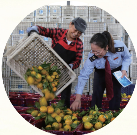
“绿税助企”团队服务水之源柑桔专业合作社柑桔出口