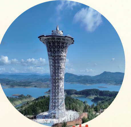
位于丹江口市三官殿办事处的地标建筑——沧浪之光