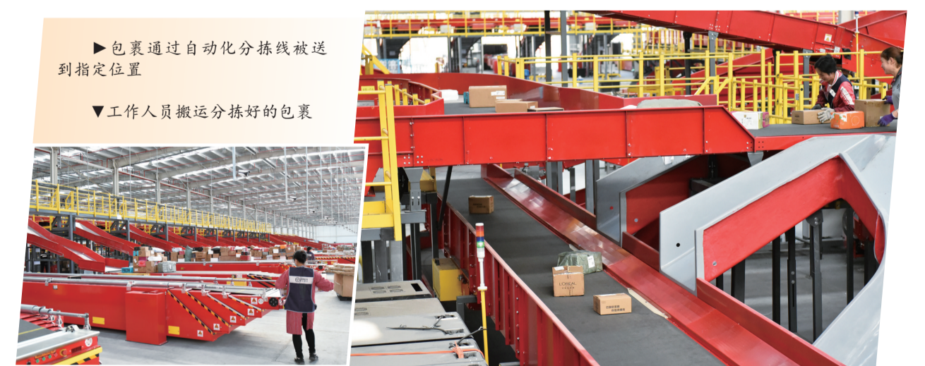
▶包裹通过自动化分拣线被送到指定位置

快递分拣是快递物流中的重要环节。以前，快递分拣多为人工完成，分拣员根据包裹上的地址信息，判断下一个路径并进行分拣，这样不仅耗时、耗力，还容易出错。随着科技发展，智能分拣已成为快递物流行业的趋势。在顺丰十堰中转场，记者几乎看不到