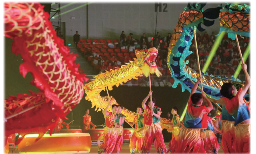
开场舞蹈《山水欢歌·龙凤呈祥》