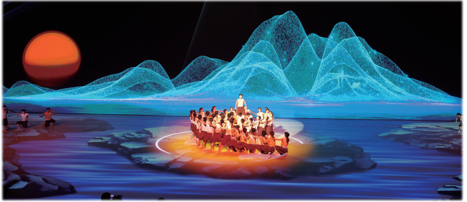
大型歌舞《汉江故事》