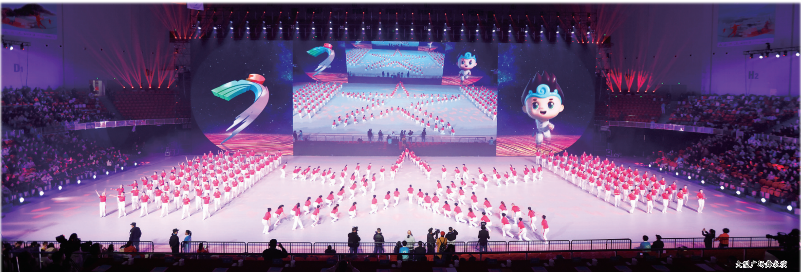
大型广场舞《龙凤呈祥》