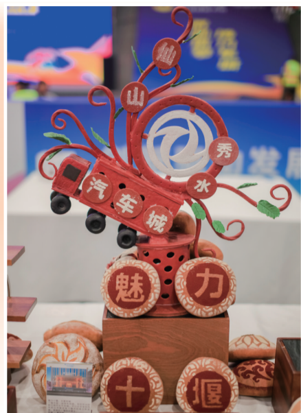
选手们巧妙构思，创造出集美味与颜值于一体的面点。