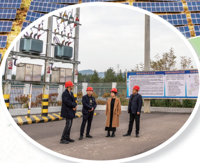
了解光伏项目运营情况