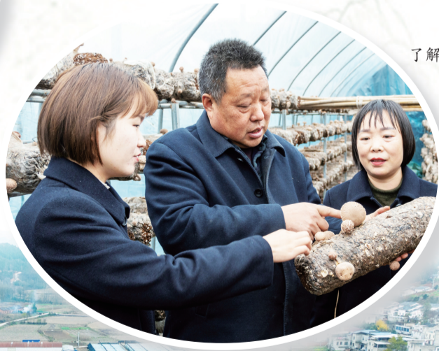
了解香菇产业情况