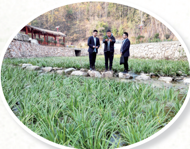
走访河道菖蒲种植