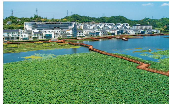
太极湖新区