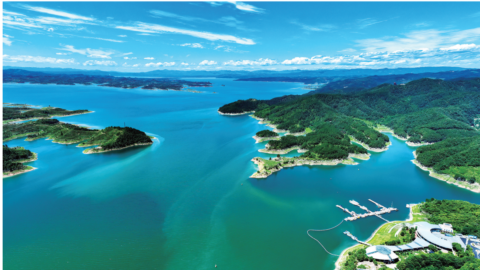
太极湖码头