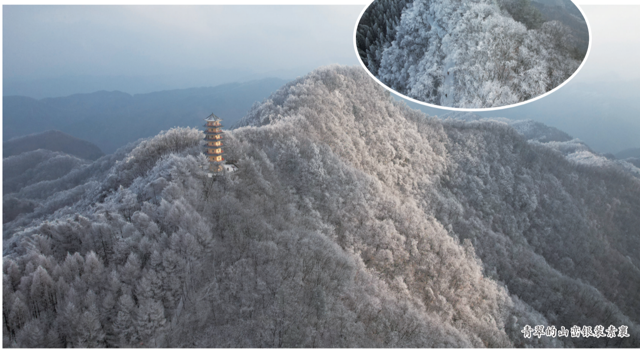
游客在雾凇中漫步观赏