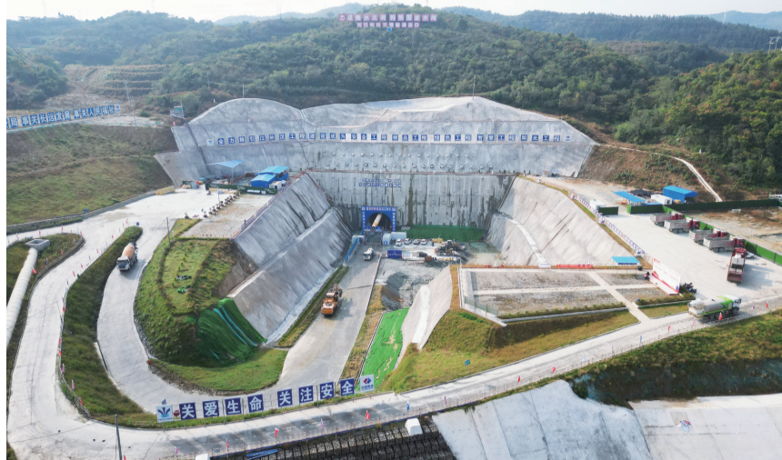
引江补汉工程出口段施工现场

引江补汉工程,堪称一条连接两大“国之重器”的“地下河”。该工程从长江三峡库区引水入汉江丹江口水库下游,提高汉江流域水资源调配能力,增加了南水北调中线工程北调水量。作为南水北调后续工程首个开工项目,该工程是全面推进南水北调后续工程高质量发展、加快构建国家水网主骨架和大动脉的重要标志性工程。工程开建一年多来,承建单位如期推进主体隧洞施工进度,加快建设数字孪生引江补汉。据测算,工程建成后,南水北调中线多年平均北调水量将由95亿立方米增加至115.1亿立方米。