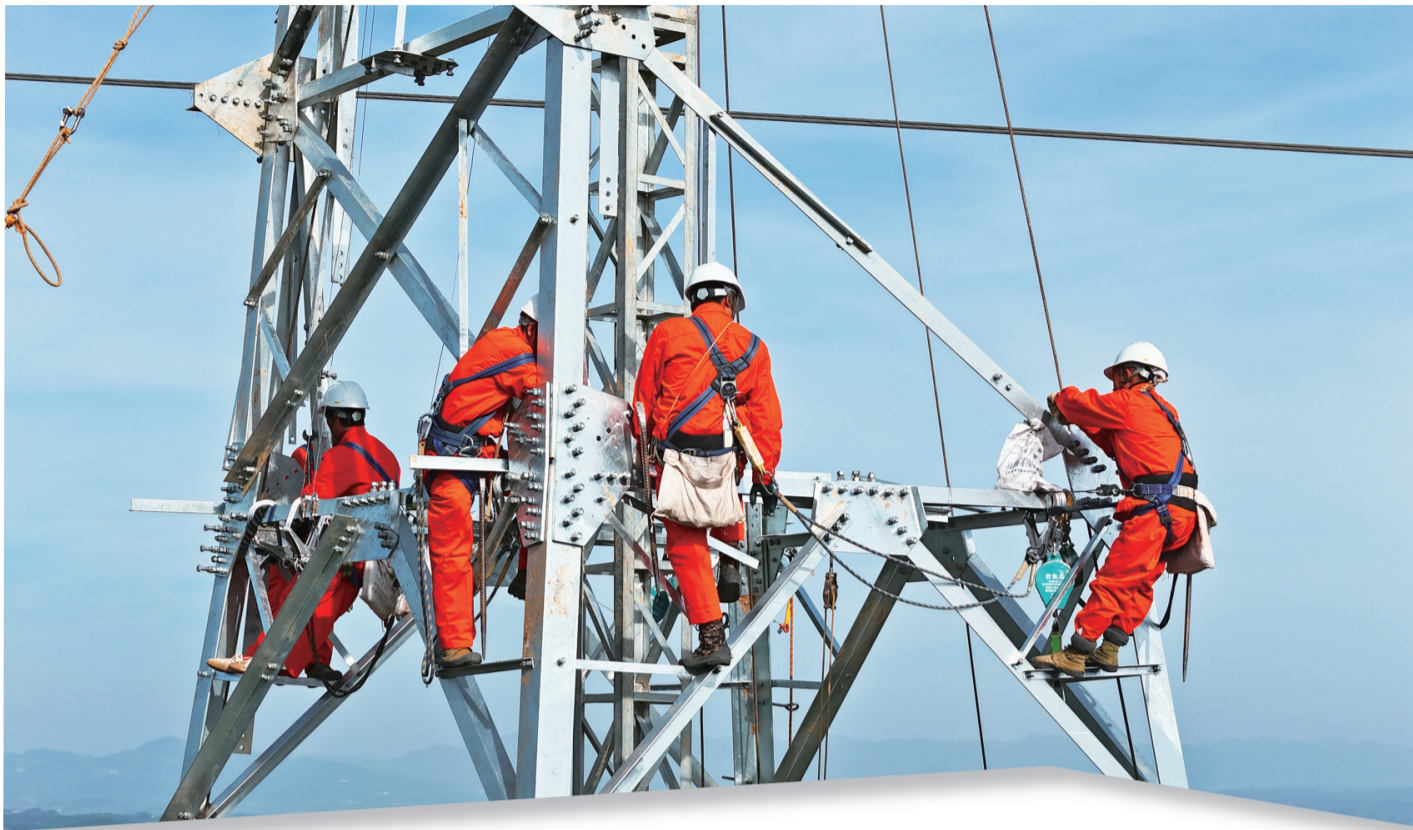
汉水500千伏变电站配套220千伏送出工程施工现场

弘扬铁军精神,彰显使命担当。2023年,十堰巨能电力集团始终心系“国之大者”,矢志不渝保障电力可靠供应、提高供电服务品质,既推动集团事业高质量发展再上新台阶,又在服务经济社会发展和满足人民美好生活需要上交出了一份优异答卷。