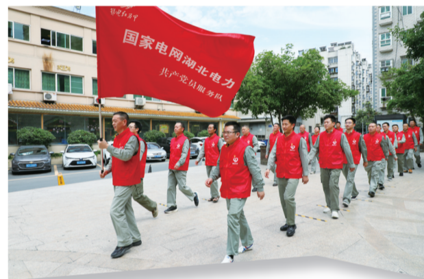
十堰巨能“南水北调”共产党员服务队

安全是企业一切工作的基础和前提。从安全管理到安全检查,再到客户安全评价,凸显的正是十堰巨能电力集团狠抓安全生产,筑牢安全防线的举措和成效。2023年,集团认真落实安全生产主体责任,以安全为“底线”,拧紧全员责任螺丝,持续加强“四个管住”,深化作业风险管控。所有开工项目按照“月计划、周安排、日管控”要求,1-11月录入周作业计划1786项,执行率98.43%;日安排7779项,执行率99.78%,开展作业现场稽查7747次,稽查覆盖率99.59%,各级领导干部现场履职履责、到岗到位2955次,创建“无违章作业现场”32个。发布2023年度施工核心劳务分包队伍名录30家,约谈分包队伍2家。组织开展消防应急疏散演练、“五备三报一救护”等专项应急演练活动。结合省市公司重大事故隐患专项排查整治2023行动方案,开展重大安全隐患专项排查,安全生产基础不断夯实。