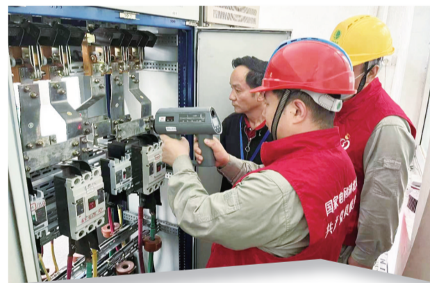
主动为用户电气设备测温