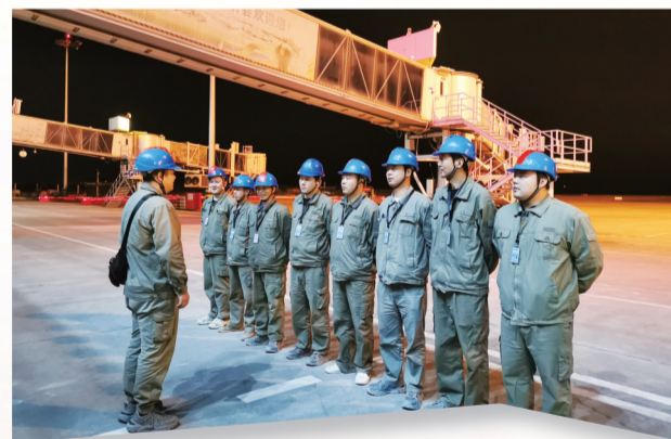
武当山机场零点检修

持续深化施工设计监理管理,购置施工机具固定资产200万元,加大施工现场新型装备应用,提升业务承载能力。以创新工作室建设为载体,发明实用型工器具提高工程建设效率,两项施工装置发明获国家专利,设计公司新增新能源专业乙级资质。以班组建设成效评估为基础,开展不健康班组问题整改,不断实现班组基础管理制度化、规范化、标准化、精细化。引导核心业务自主实施,输电组塔、架线、配电专业等主体工程坚持“领着干”,不断巩固传统业务优势。积极参与“堰苗计划”,参与高压试验跟班学习,成立柔性小组,提升自主实施业务范围和能力。组织项目经理及项目关键人员85人参与基建安全质量培训,6人获省公司二级安全技术等级认证。晚上伏案疾书,一天要打上上百个电话、走十几里山路……充分发挥了党员的先锋模范作用。临时党支部把全体人员拧成一股绳,大家充分发挥攻坚克难的拼搏精神和精益求精的严谨作风,用200多个日夜的艰苦付出与执着坚守,确保工程建设高水平、高质量完成,为项目顺利投运和十堰经济社会高质量发展贡献了巨能人的智慧与担当。