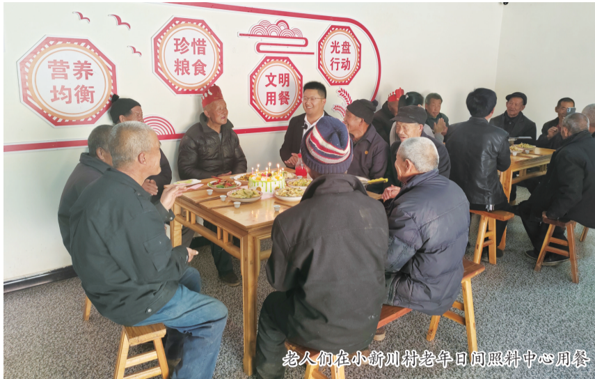
老人们在新小川村老年日间照料中心用餐

肉、青菜、紫菜蛋汤等端上桌，老人们围桌而坐，共进午餐，其乐融融。“有肉有菜，干净又卫生。”“在家门口就能吃上热乎饭，真好！”聊起食堂的饭菜，老人们赞不绝口。