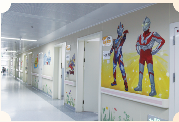
儿科病区的卡通墙绘