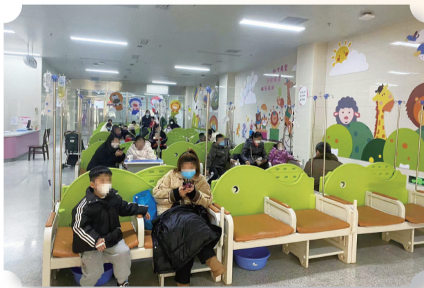
整洁舒适的急诊输液室