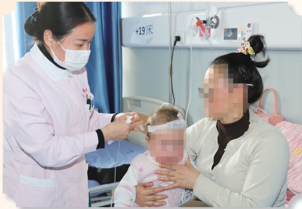
儿科护士正在为患儿治疗

尽管该科室处于高负荷运转状态，但各项工作均紧张有序进行。“竭尽所能克服一切困难，做到应收尽收、应治尽治，解决患儿就医需求！”该院党委书记刘杰说。