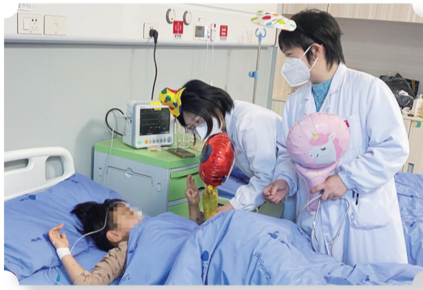
医生带着礼物查房

在市妇幼保健院总院儿科一病区一间病房，记者看到，一名康复技师正在为患儿作手部穴位推拿，他说：“我是从中医康复科调来的，部室有三分之一的人都到两个儿科病区来帮忙了。”