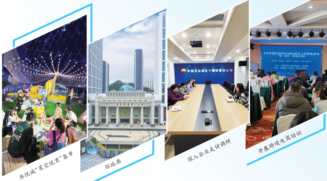
华悦城“星空悦里”集市

今年以来，茅箭区深入贯彻落实中央、省委、市委经济工作会议精神及各项促消费政策，坚持绿色低碳发展理念，全力以赴稳外贸稳外资促消费，商贸经济交出了亮眼“成绩单”。