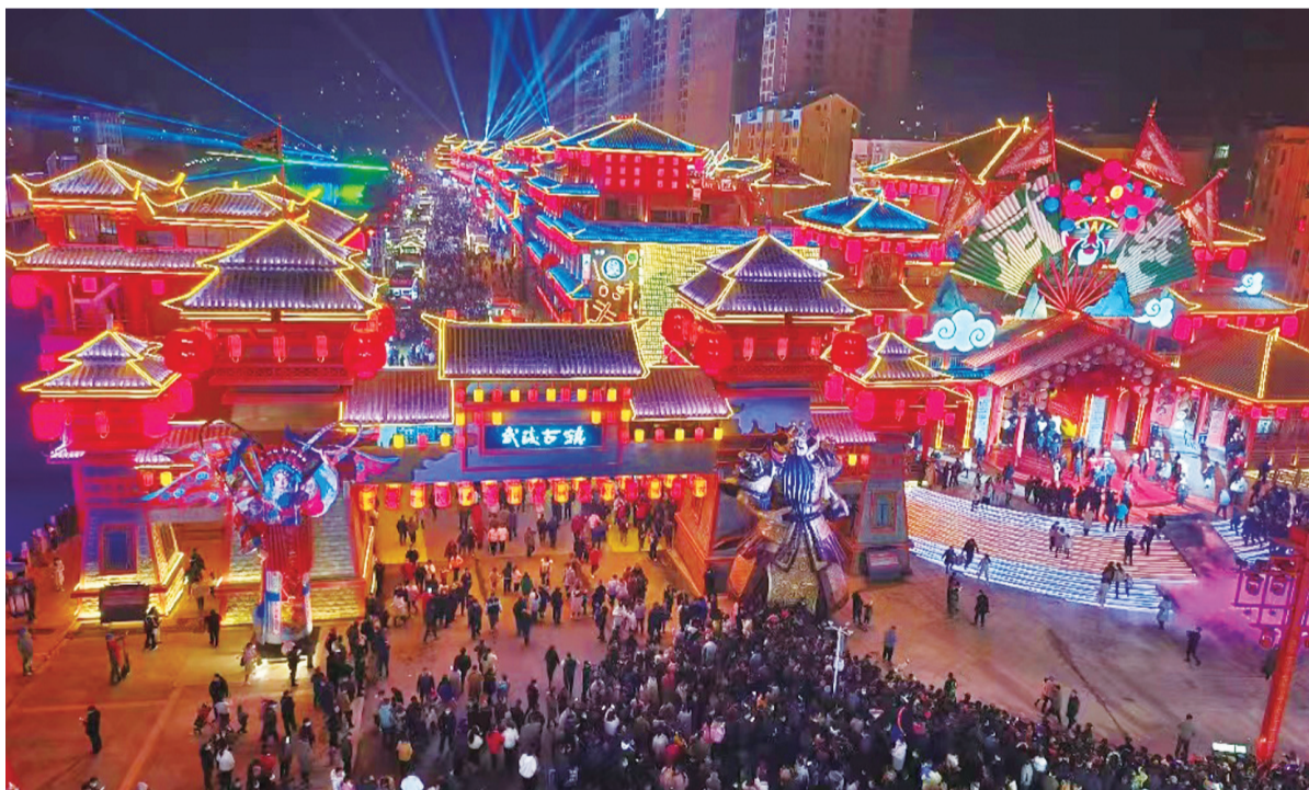
武陵不夜城开街当日,吸引了众多游客前往。

本报讯 记者余杰 纪枫波 吴守全 特约记者郭浩 郭军报道:2023年12月30日晚,竹溪县倾力打造的沉浸式文旅街区“武陵不夜城”正式开街。开街首日,接待游客突破10万人。