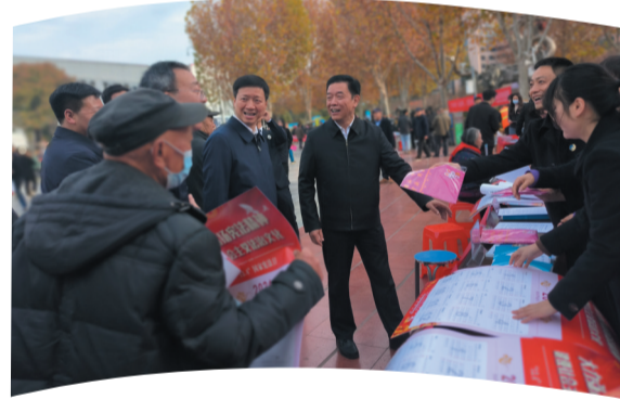
2023年宪法宣传周活动现场

线下活动有声有色，“指尖上的普法”如火如荼。发挥“网、端、微、屏”等载体的普法优势，以“法治十堰”微信公众号为牵引，构筑起市级媒体普法专栏为主体、县级普法矩阵为支撑、基层普法微信群打基础的融媒体普法格局，形成《十堰晚报》“案·鉴”“张湾普法”抖音号、“郧阳区融融说法”“吕家河民歌普法”“郧和律所普法”等系列品牌。