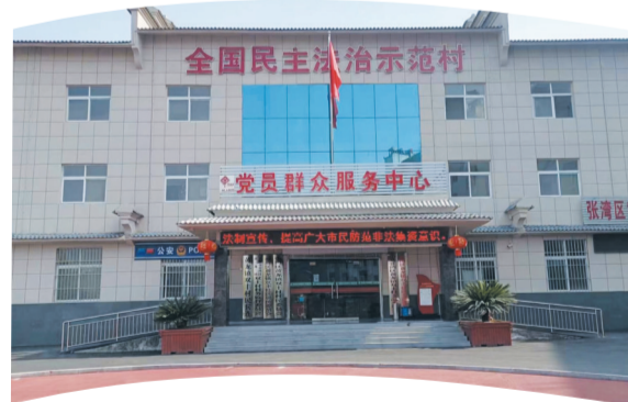
全国民主法治示范村——张湾区黄龙镇双丰村

“全市法治建设中期督察和‘八五’普法中期评估已圆满结束。我们将切实用好考核指挥棒，倒逼普法责任落实落细。在后半程，将持续点燃普法引擎，激活法治动力，擘画法治十堰新篇章。”市司法局党组书记、局长，市委全面依法治市委员会守法普法协调小组副组长张树群说。