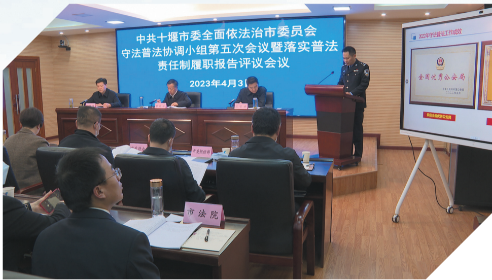
2023年全市普法责任制履职评议会

“八五”普法启动以来，我市深入学习贯彻党的二十大精神和习近平法治思想，始终坚持以人民为中心，加大新时代全民普法力度，扎实推进新形势基层依法治理。党委政府中心工作在哪儿，阶段性重点工作在哪儿，普法工作就跟进到哪儿，职能作用就发挥到哪儿，已成为我市普法与依法治理工作最为鲜明的特色。2023年，我市成功创建省级法治政府建设示范市，并被省委、省政府推荐为第三批全国法治政府建设示范创建候选城市，人民群众的法治获得感、幸福感、安全感持续增强。