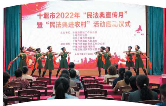
2022年十堰市民法典宣传月启动仪式

项工作责任》《十堰市国家机关普法责任制考核评估标准》，每年5家单位现场晒出普法“成绩单”，当场点评、打分，其它单位书面评议，进行社会公示，“谁执法谁普法”等普法责任制落实取得明显成效。全市国家工作人员学法用法及考试常年参考率、及格率100%，优秀率97%以上，位居全省前列。党委领导、政府主导、人大监督、政协支持、部门各负其责、社会广泛参与、人民群众为主体的大普法工作格局进一步得以巩固。