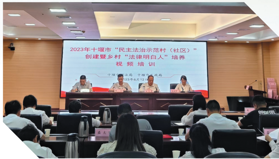
2023年全市民主法治示范村（社区）创建暨乡村“法律明白人”培养视频培训