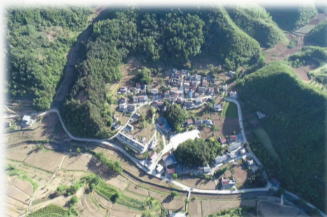
门古寺镇彭家湾村现貌