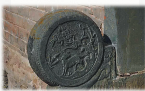
彭家祠堂门前石鼓