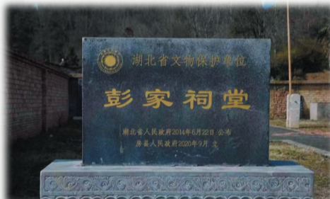
重点文物保护单位标牌