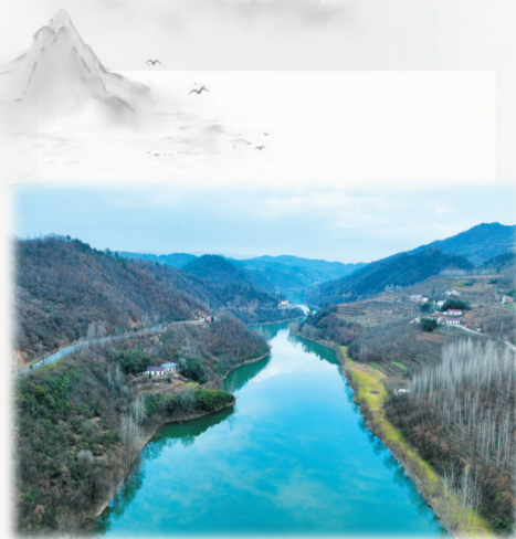
马栏河(古彭水)碧水如镜映蓝天

黄沙吹老了岁月，却挥不去历史的印记。彭祖，以及他的后人们在房县立国200年的彭部落方国，对房县文明进步特别是农业、酿酒、烹饪、文化、体育、医学、教育的发展，风俗人情的教化和形成，无疑具有巨大的影响和推动作用，只是因为时代久远，没有考古遗存发现，逐步尘封在岁月的黄沙中，渐渐被人淡忘。正如十堰史志专家潘彦文先生所感言，人们大概因为十堰有了祖师爷（真武大帝）就淡忘了彭祖。