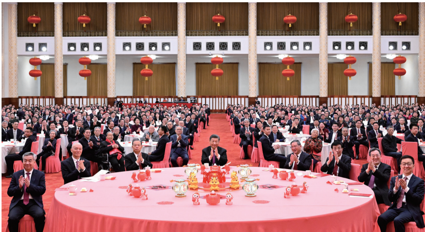
2月8日,中共中央、国务院在北京人民大会堂举行2024年春节团拜会。党和国家领导人习近平、李强、赵乐际、王沪宁、蔡奇、丁薛祥、李希、韩正等同首都各界人士齐聚一堂,共迎新春。

新华社北京2月8日电 中共中央、国务院8日上午在人民大会堂举行2024年春节团拜会。中共中央总书记、国家主席、中央军委主席习近平发表讲话,代表党中央和国务院,向全国各族人民,向香港特别行政区同胞、澳门特别行政区同胞、台湾同胞和海外侨胞拜年。