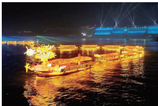
丹江口大坝金龙游汉江灯光秀。