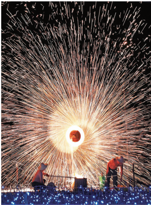
竹山圣水湖景区上演打铁花民俗表演。

新春佳节,全市各地洋溢着欢乐喜庆的节日氛围。在丹江口大坝、竹溪武陵不夜城、竹山圣水湖、房县西关印象等景区,花灯、激光、水秀、彩船等将景区装扮得流光溢彩、缤纷璀璨,精彩纷呈的民俗表演引得市民纷纷前往观赏游玩,感受浓浓的年味。