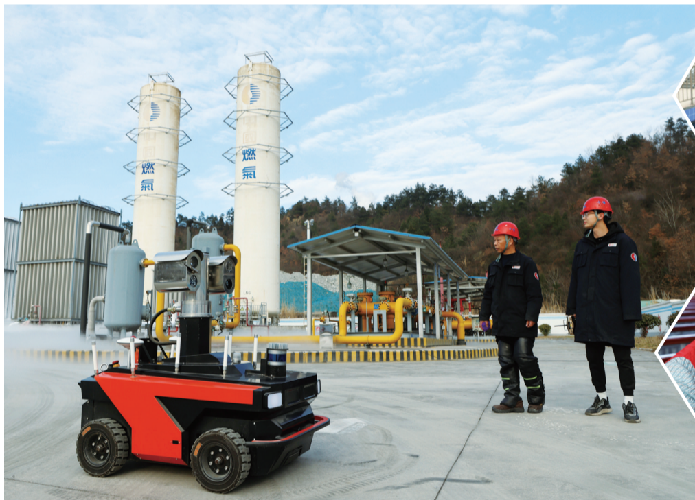
2月16日，在十堰中燃LNG储备调峰站，工作人员与机器人协同配合进行巡视。

春节是中国的传统节日，当大家阖家团聚、举杯庆祝时，有这样一群人，他们放弃与家人团聚、放弃休息，坚守在工作岗位上，为群众安全、欢乐过节保驾护航。