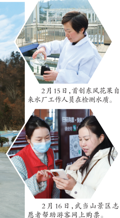
2月15日，首创东风花果自来水厂工作人员在检测水质。

的蚌壳跳起来，一场场民俗表演，吸引了众多群众驻足观看。演出现场，欢声笑语，掌声雷动，处处洋溢着欢乐喜庆的节日气氛。