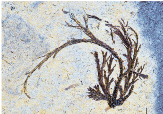
新发现的植物根系化石

属种,其涉及石松、节蕨、种子蕨等植物门类。这些古植物大多是已湮灭的早期类型,生活时期可追溯到石炭纪早期。