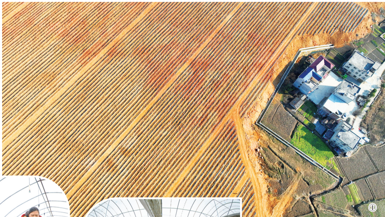
①2月20日,无人机拍摄的房县城关镇三海村地膜保湿节水土豆产业基地。 ②2月21日,在张湾区黄龙镇双丰村,村民在蔬菜大棚里采收菠菜,为种植芹菜做准备。 ③2月22日,在竹山县深河乡双湾村温室大棚里,村民在育苗盘上播撒种肥混合物。