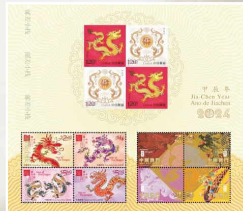
中国邮政携手港澳邮政，首次共同印制的生肖题材邮票小全张