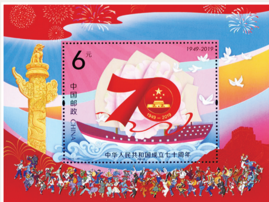
2019-23 中华人民共和国成立七十周年小型张