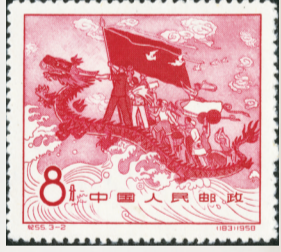
2018-4 全国工业交通展览会(3-2) 力争上游