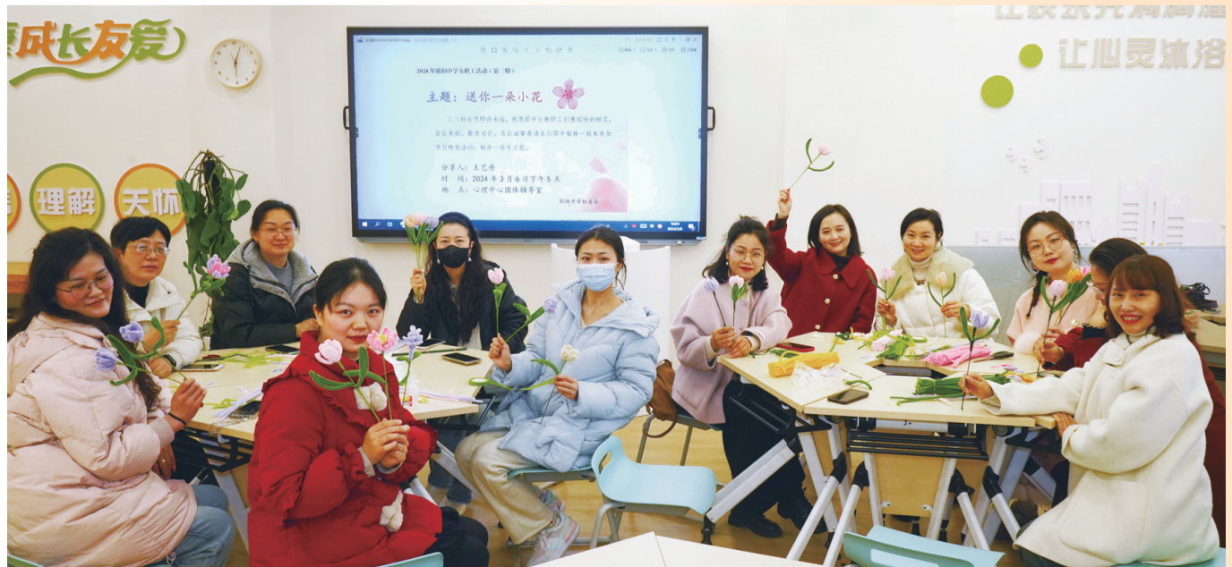
3月6日，郧阳中学妇委会邀请“郧中姐妹”一起动手，为自己制作一朵手工花。图为“郧中姐妹”展示自己的手工花。