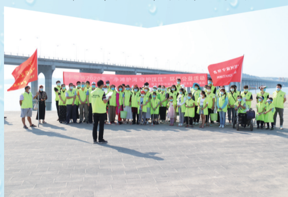
民间河长保护汉江行动