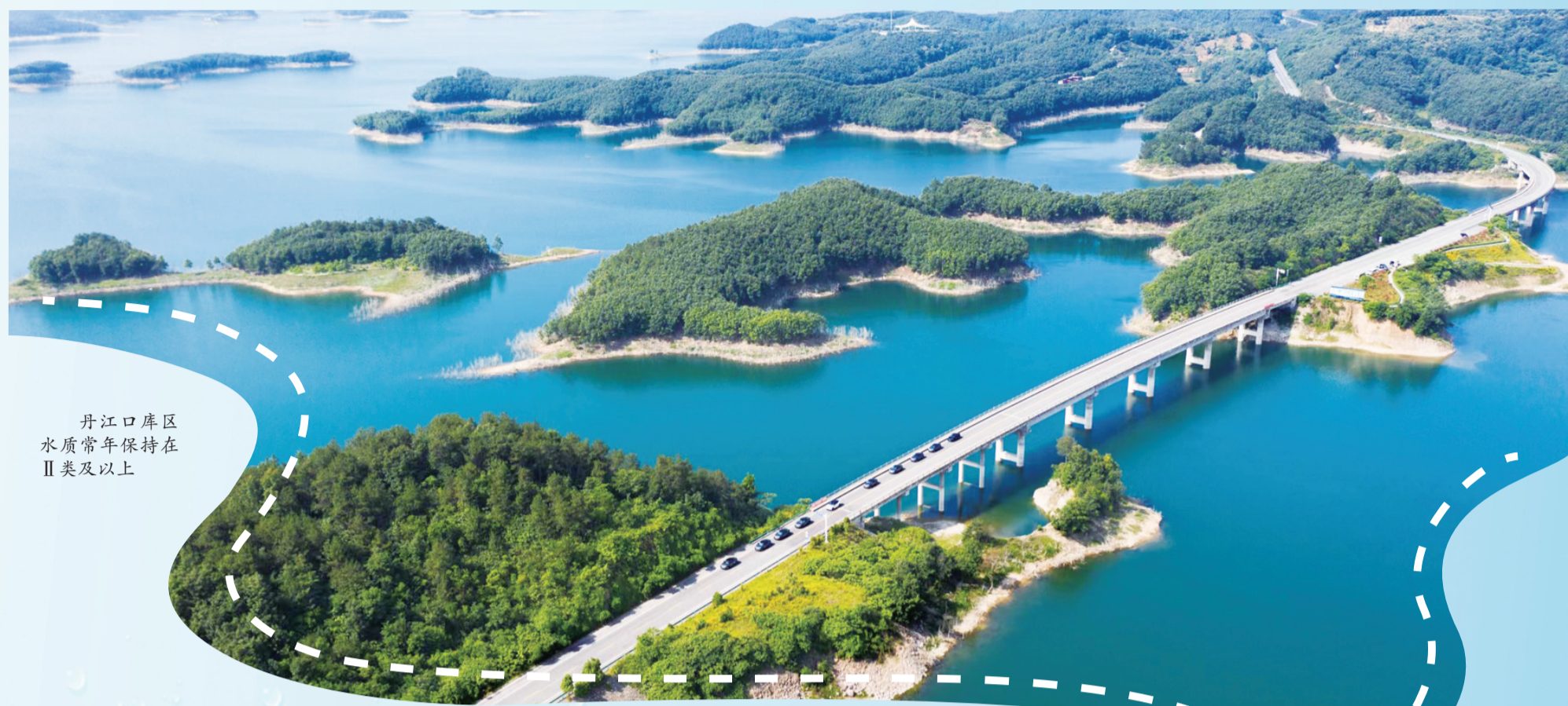
丹江口库区水质常年保持在Ⅱ类及以上

江河竞秀，碧水奔腾，一日千里。从空中俯瞰，一泓碧水如同美丽的宝石镶嵌在十堰大地，条条绿丝带环绕巍巍青山，在这片生机勃勃的土地上逶迤穿行……十堰市是南水北调中线工程核心水源区、国家战略性水源地、重要生态功能区。近年来，全市水利和湖泊系统深入践行习近平总书记“节水优先、空间均衡、系统治理、两手发力”的治水思路，锚定推进新阶段水利高质量发展总目标，坚决守住流域水安全底线，加快构建现代水网，持续改善河湖生态环境，着力推进水利现代化，为十堰加快建设绿色低碳发展示范区、确保“一库碧水永续北送”提供坚强水利支撑。