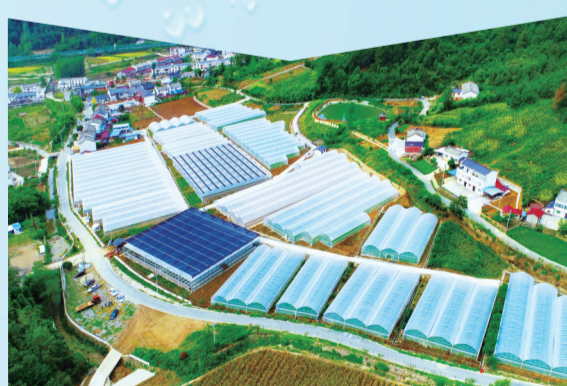
房县长峪河生态清洁小流域