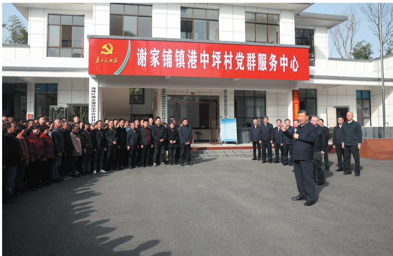
3月18日至21日,中共中央总书记、国家主席、中央军委主席习近平在湖南考察。这是19日下午,习近平在常德市鼎城区谢家铺镇港中坪村考察时,同乡亲们亲切交流。

新华社长沙3月21日电 中共中央总书记、国家主席、中央军委主席习近平近日在湖南考察时强调,湖南要牢牢把握自身在构建新发展格局中的战略定位,坚持稳中求进工作总基调,坚持高质量发展不动摇,坚持改革创新、求真务实,在打造国家重要先进制造业高地、具有核心竞争力的科技创新高地、内陆地区改革开放高地上持续用力,在推动中部地区崛起和长江经济带发展中奋勇争先,奋力谱写中国式现代化湖南篇章。