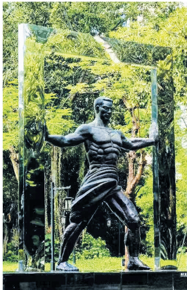
深圳博物馆广场主雕《国门》