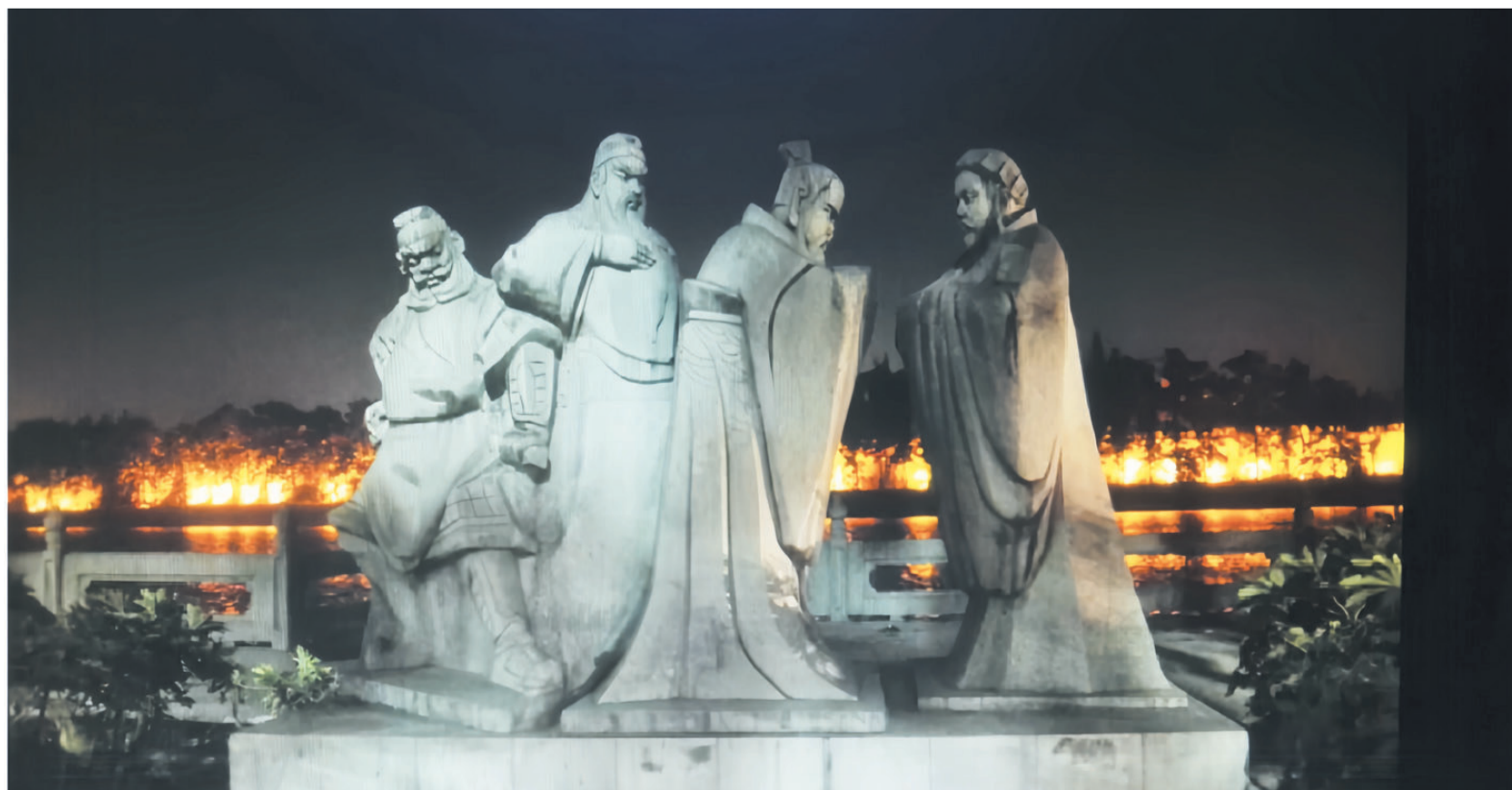
襄阳市汉江一桥石雕《三顾茅庐》