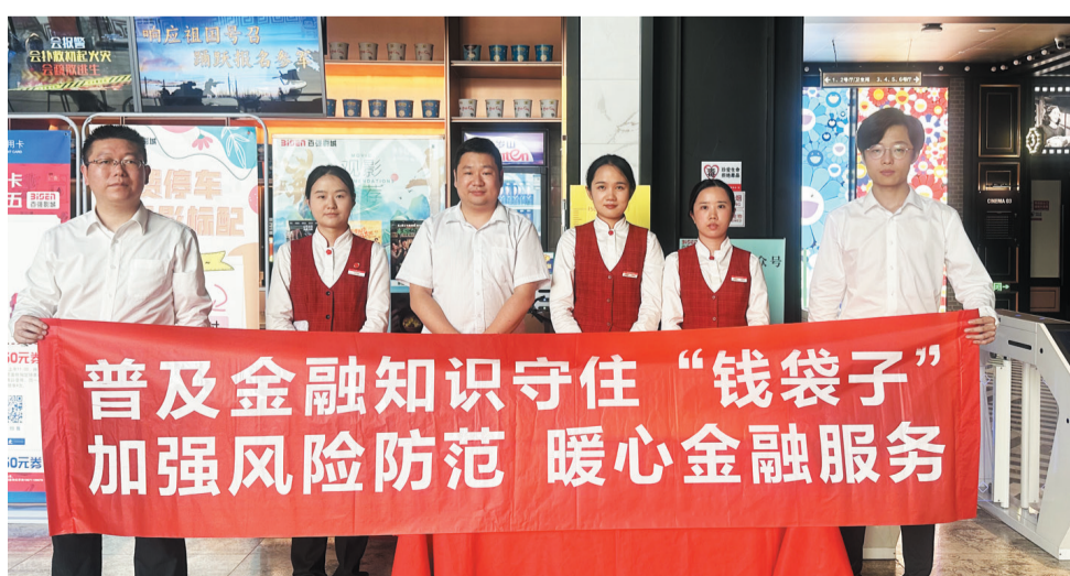
中信银行十堰分行开展金融风险防范宣传活动

结合方案要求,各网点积极行动,在营业场所宣传区摆放防范非法集资、防范电信诈骗等金融知识宣传手册。同时依托网点公众教育服务区、厅堂、柜台等场所,向到访客户及网点流动人群发放宣传折页,对客户进行“树立正确理财观念,警惕高息集资陷阱;时刻绷紧防范弦,莫贪蝇利防受骗”等风险提示,增强客户金融风险防范意识。