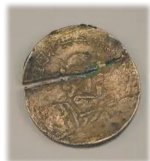
鄂北农民银行发行的马克思、列宁头像银元