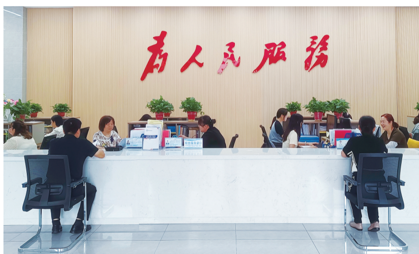
武当路街道路北社区便民服务中心提供“一站式”服务,居民办事更轻松。