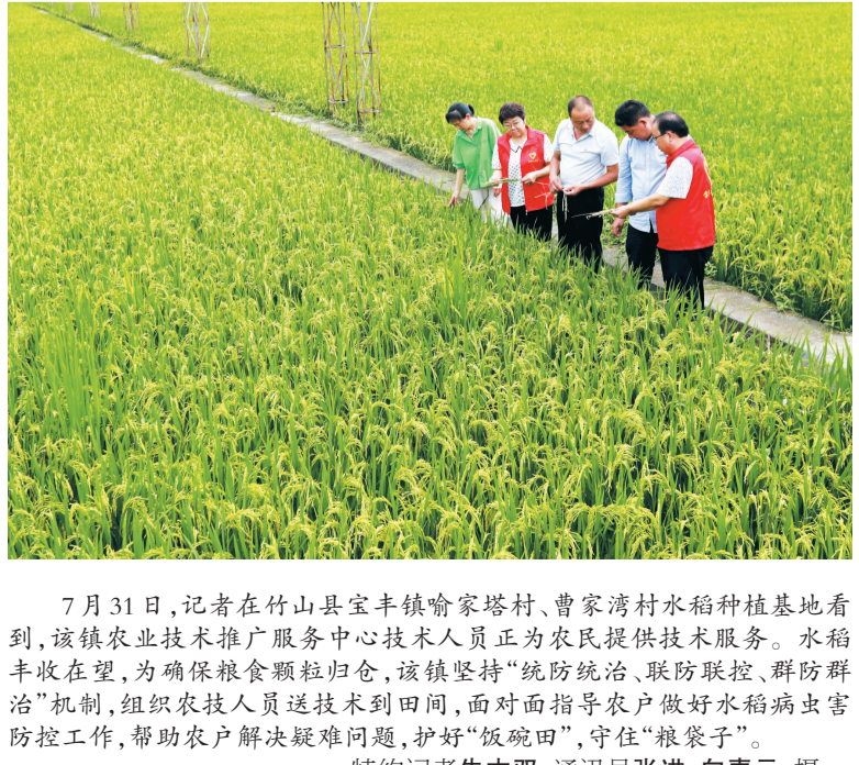
7月31日，记者在竹山县宝丰镇喻家塔村、曹家湾村水稻种植基地看到，该镇农业技术推广服务中心技术人员正为农民提供技术服务。水稻丰收在望，为确保粮食颗粒归仓，该镇坚持“统防统治、联防联控、群防群治”机制，组织农技人员送技术到田间，面对面指导农户做好水稻病虫害防控工作，帮助农户解决疑难问题，护好“饭碗田”，守住“粮袋子”。