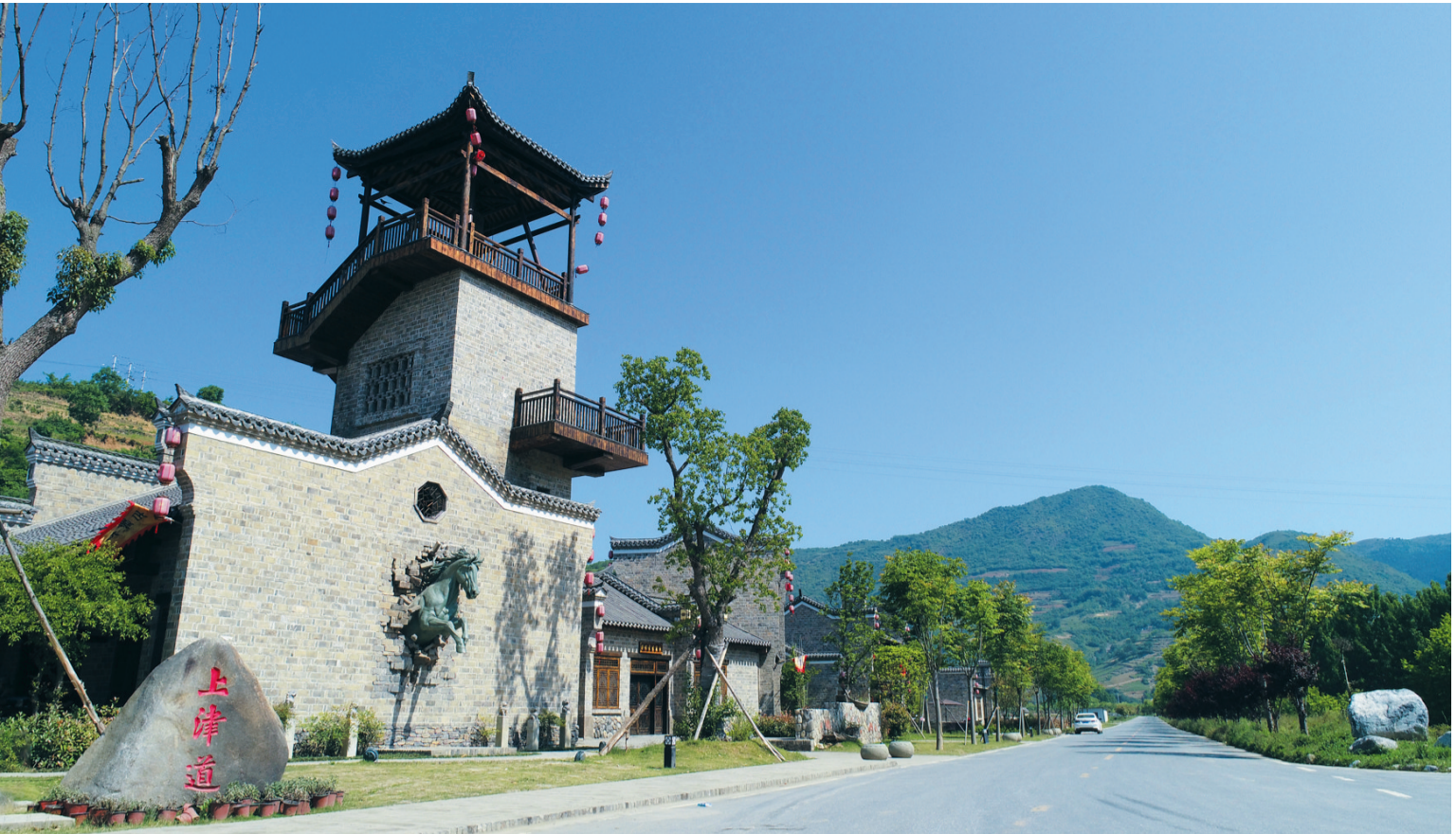
郧西县上津镇上津道景点

镐京的周文王要想“化行南国”,必须先要翻越秦岭抵汉水,这就迫切需要一条镐京直达汉水的河流,连通南方与北方。但是,我国地势西高东低,黄河、长江、汉水、淮水等主要河流的走向都是从西向东,加上地形地貌的限制,水运东西方向运输较容易,南北方向运输难于上青天,这是中国古代水运的“瓶颈”,几千年无解。直到周文王之后五百多年的春秋战国时期,才有连通南北的邢沟、灵