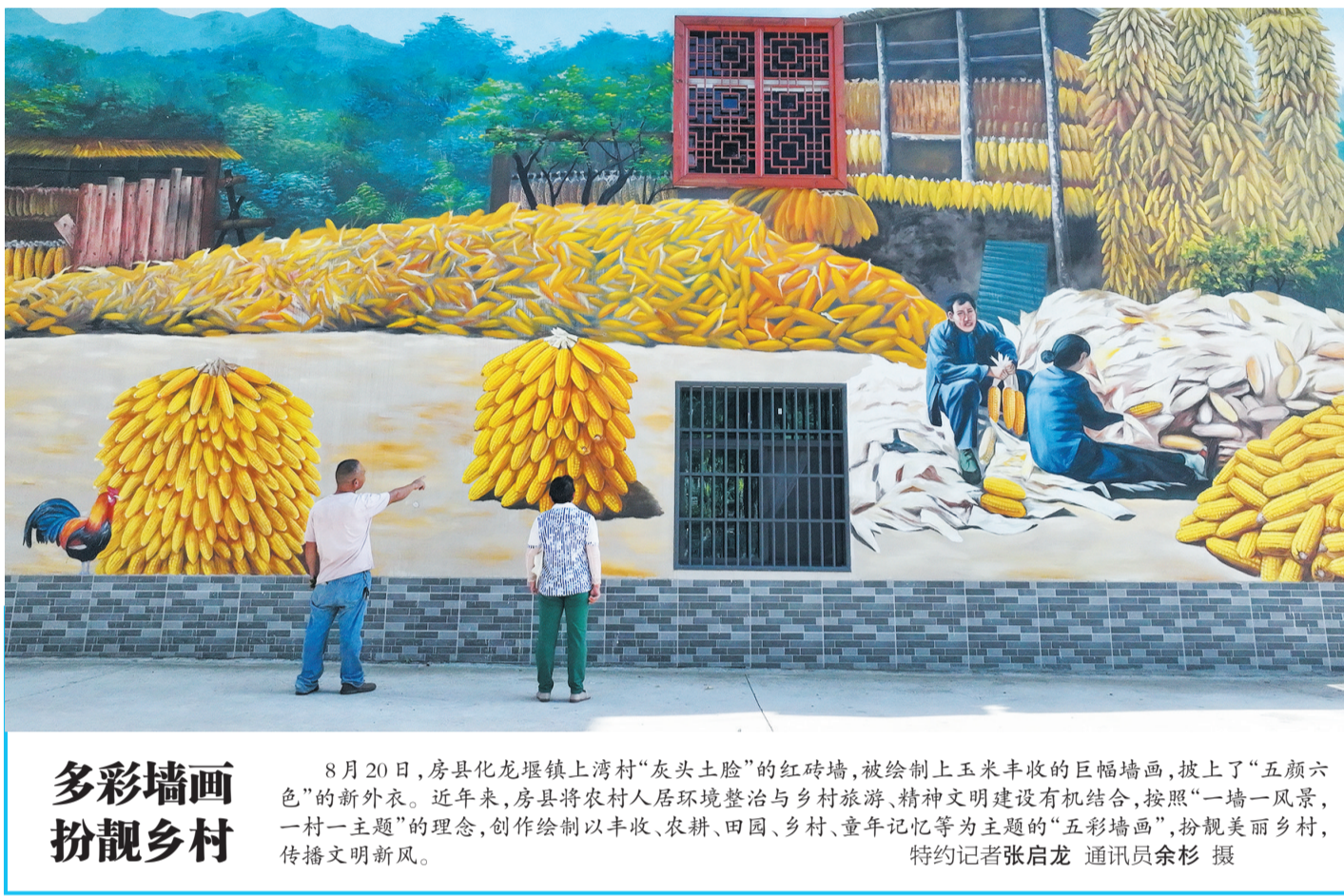
多彩墙画扮靓乡村

广泛宣传,强化引导。在市级媒体每月曝光查扣非法营运车辆情况,强化震慑警示,引导市民提升安全出行意识,努力营造全社会拒乘“黑车”的良好氛围。组织十堰城区出租车、网约车企业开展35场次驾驶员教育培训活动,促进从业人员提升安全、文明、规范的服务意识。在“三站一场”张贴“拒乘黑车、平安出行”等宣传标语,设置标识引导市民乘坐正规客运车辆出行,打造规范有序的道路运输经营环境。