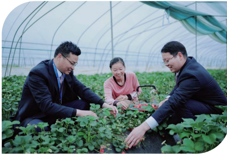
▲支持特色农业发展壮大(资料图) ▲智慧微贷解急难(资料图)

“全行抢抓重点项目集中开工建设契机，紧盯‘一主四优多支撑’产业体系，深化政银、银担、银企合作，围绕重点领域，加大信贷投放，上半年各项贷款比年初净增66.23亿元。”9月1日，十堰农商行相关负责人介绍。