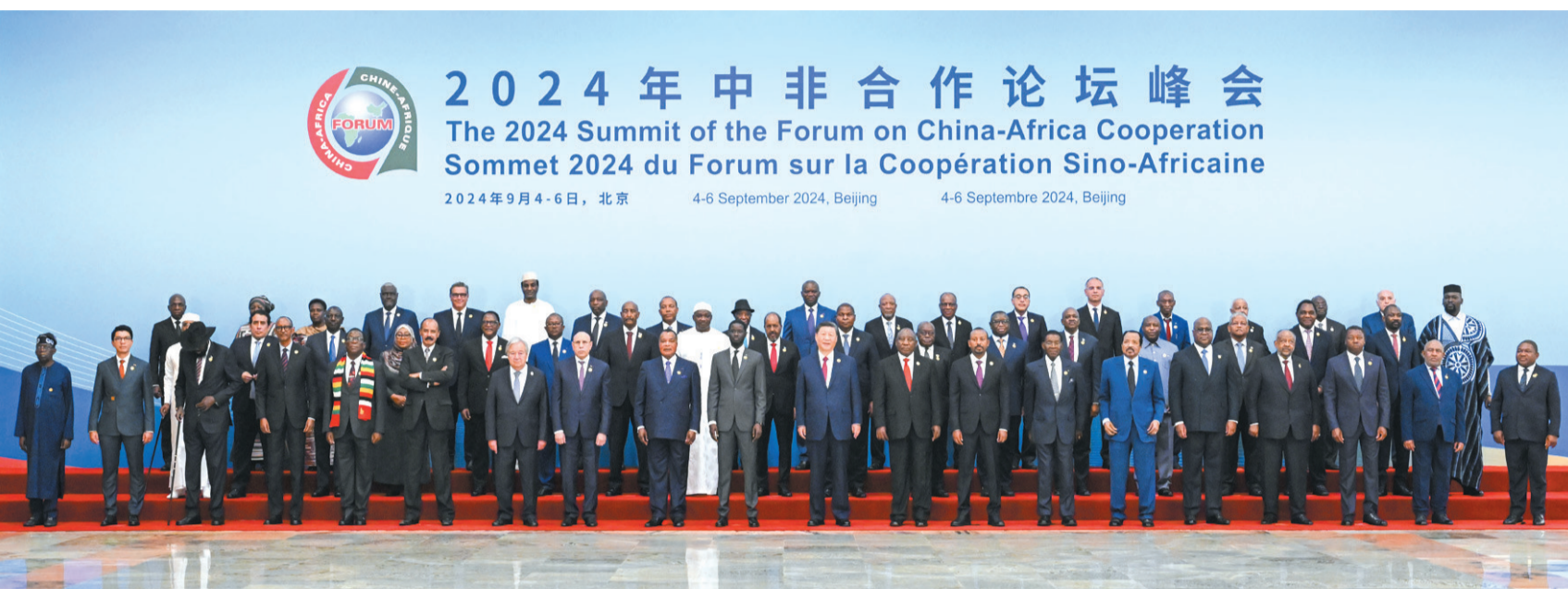
9月5日上午,国家主席习近平在北京人民大会堂出席中非合作论坛北京峰会开幕式并发表题为《携手推进现代化,共筑命运共同体》的主旨讲话。