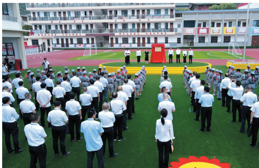
十堰首个红军小学在郧西县城关镇王家坪村揭牌。(资料图片)