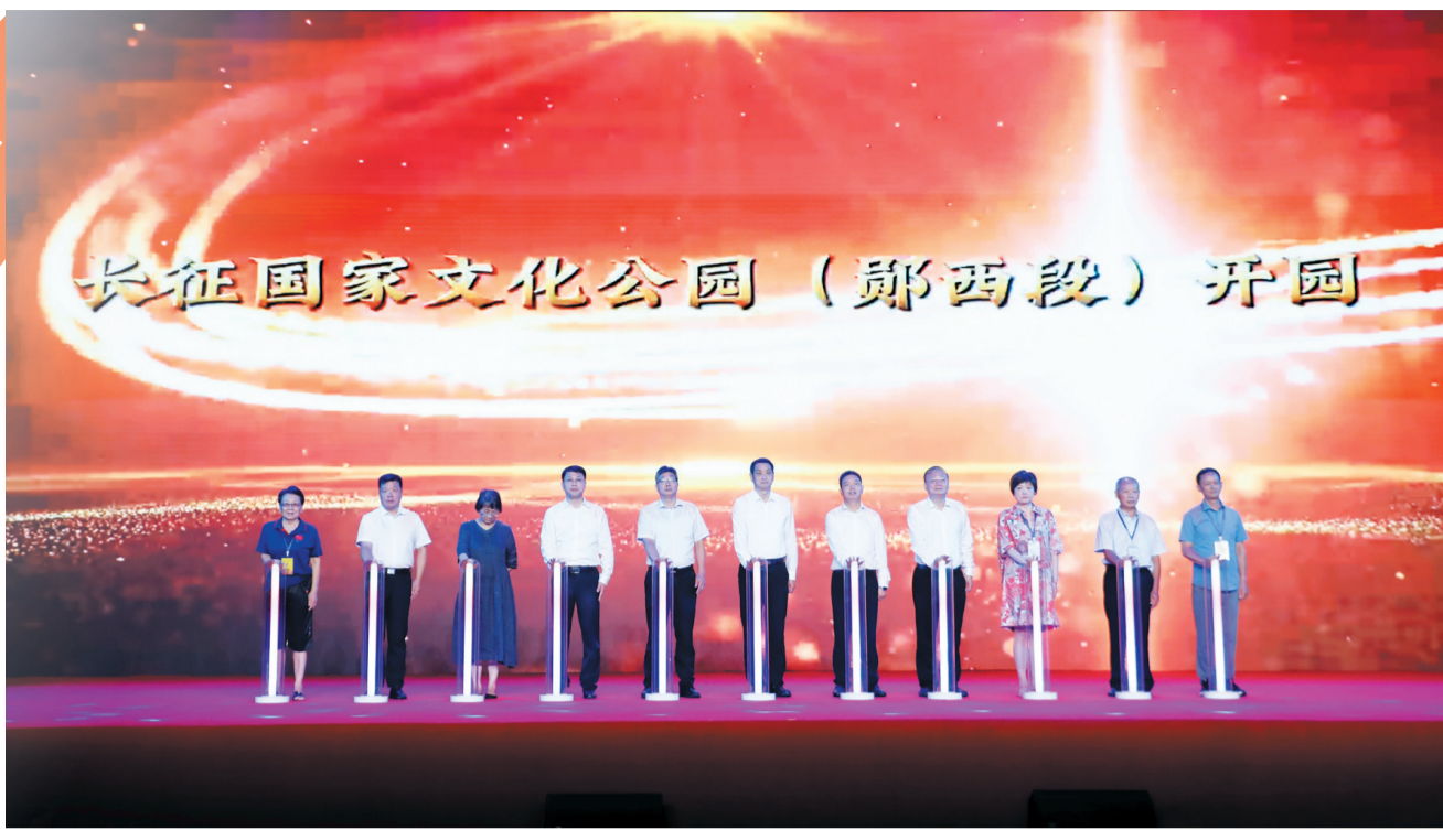
长征国家文化公园(郧西段)开园仪式。

今年以来,郧西县以长征国家文化公园(郧西段)建设为契机,开展红色文化研讨、经贸洽谈和高端智库专家郧西行等活动,签约项目数量、农特产品销售额、旅游收入刷新历史纪录,实现“文化赋能经济 经济焕新文化”,让老区人民的生活更加美好、更加幸福!