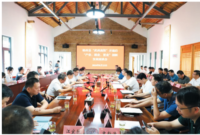
召开武西高铁开通后“产业、置业、就业”创新发展座谈会。