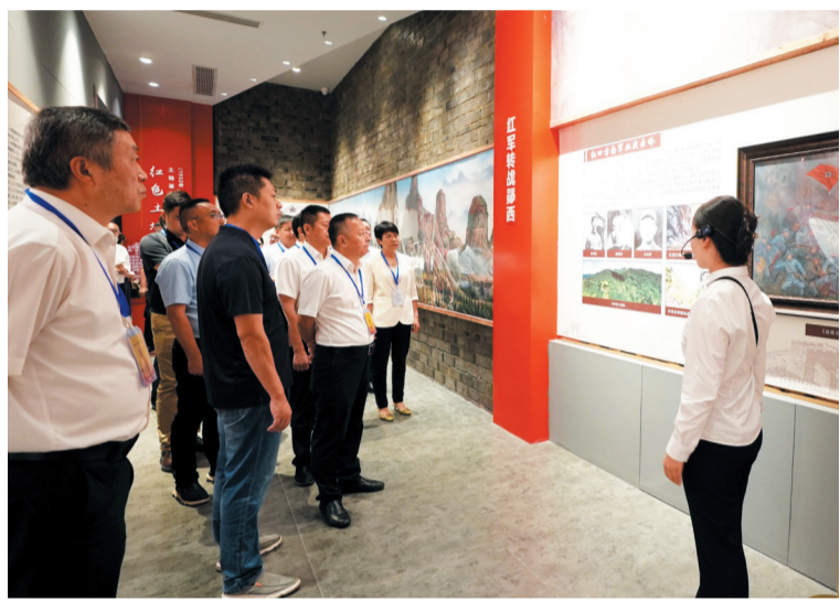
红色展馆成党史教育“实景课堂”。