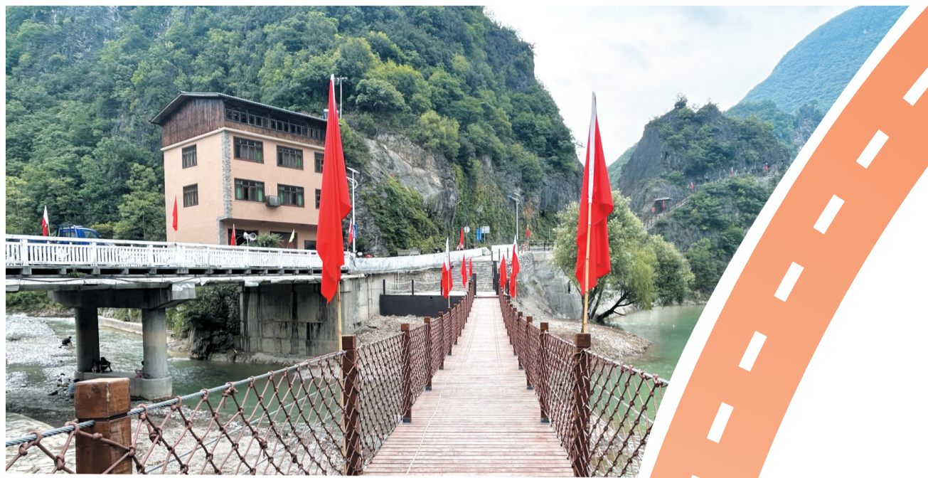
红二十五军转战郧西长征历史步道示范段。(资料图片)