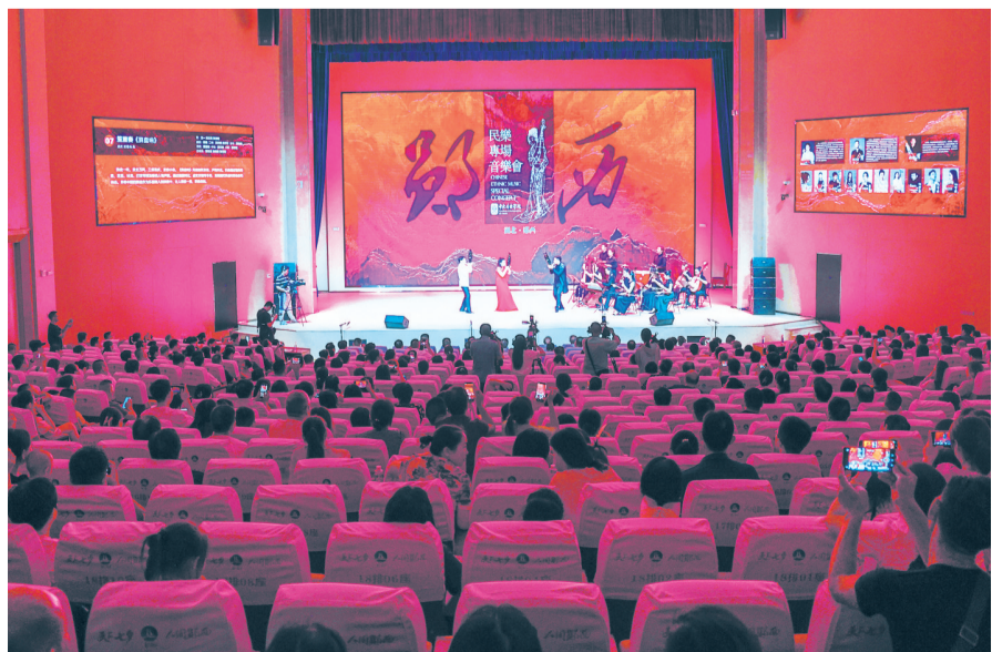
中央音乐学院在郧西举行民乐专场音乐会。