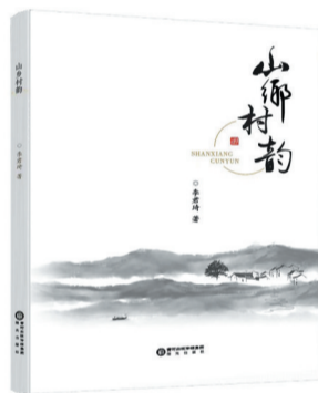
李君琦 著 阳光出版社出版