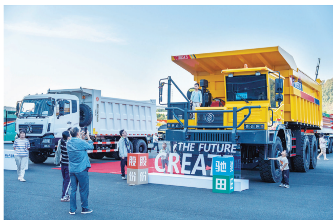
驰田汽车股份有限公司产品亮相。