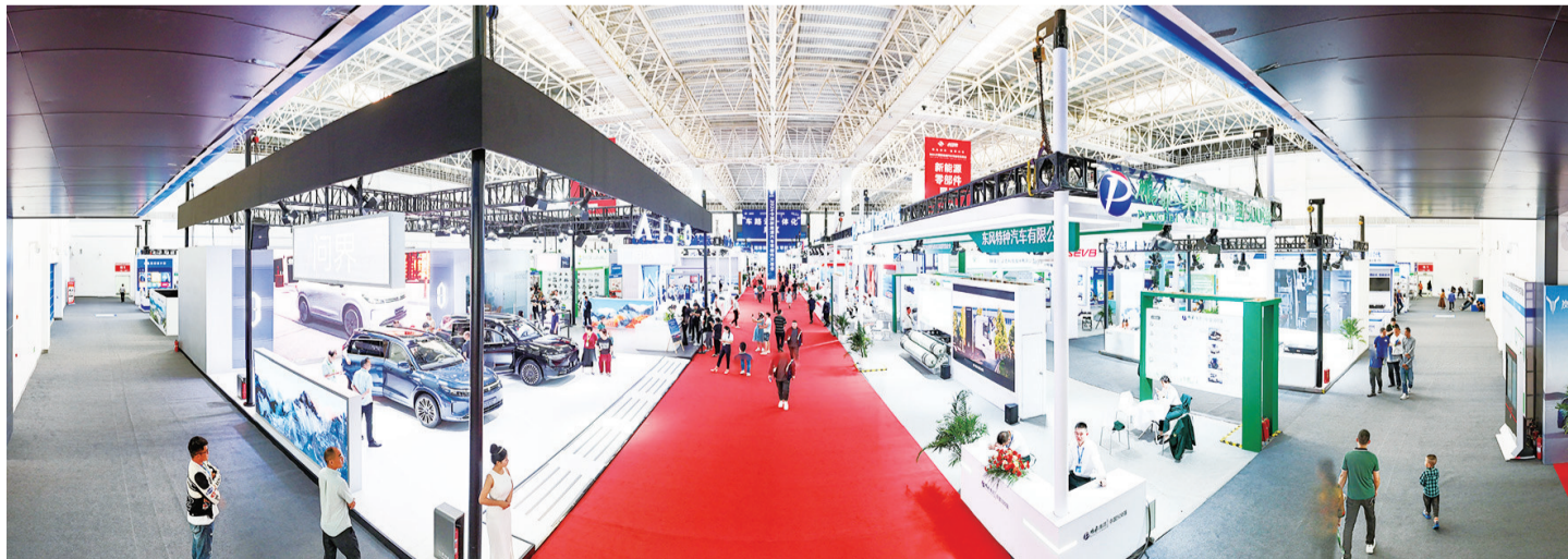
新能源整车及零部件展览。

时下，全市上下正深入学习贯彻习近平总书记给十堰丹江口库区环保志愿者的重要回信精神，高效统筹高水平保护和高质量发展，以供应链构建绿色低碳现代产业体系，坚定不移走绿色低碳发展之路。这尤其需要汽车支柱产业进一步向新能源和智能网联方向转型，进一步增强外向度、提升竞争力。在这一关键节点，举办汽车零部件交易会可谓恰逢其时。让我们乘着本次交易会的东风，抢抓汽车产业转型发展机遇，以更大的力度扩大开放，以更实的举措优化营商环境，汇聚更多前沿技术、精英人才、优质项目和优秀企业，为绿色低碳发展示范区建设汇聚强大力量。