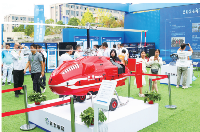
湖北箭飞航空科技有限公司带来的救援无人驾驶直升机。