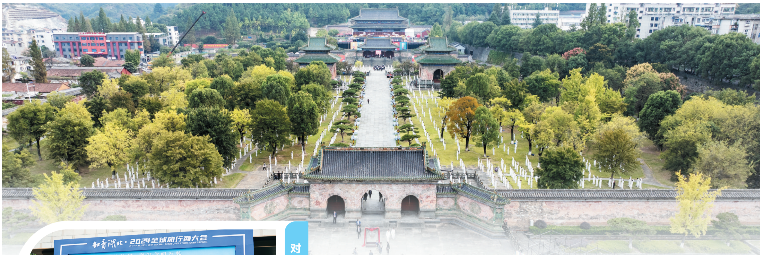
2024 世界武当太极大会在玉虚宫开幕。