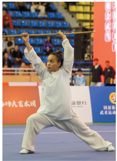
▲参加棍术比赛的外籍运动员。