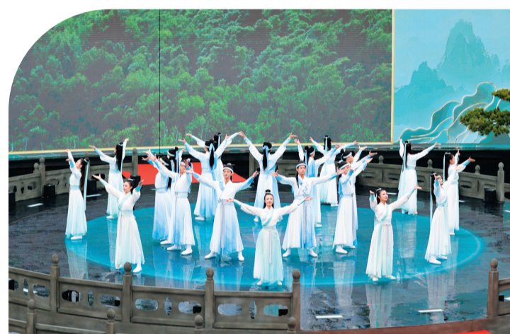
▲情境舞蹈《天人合一》。