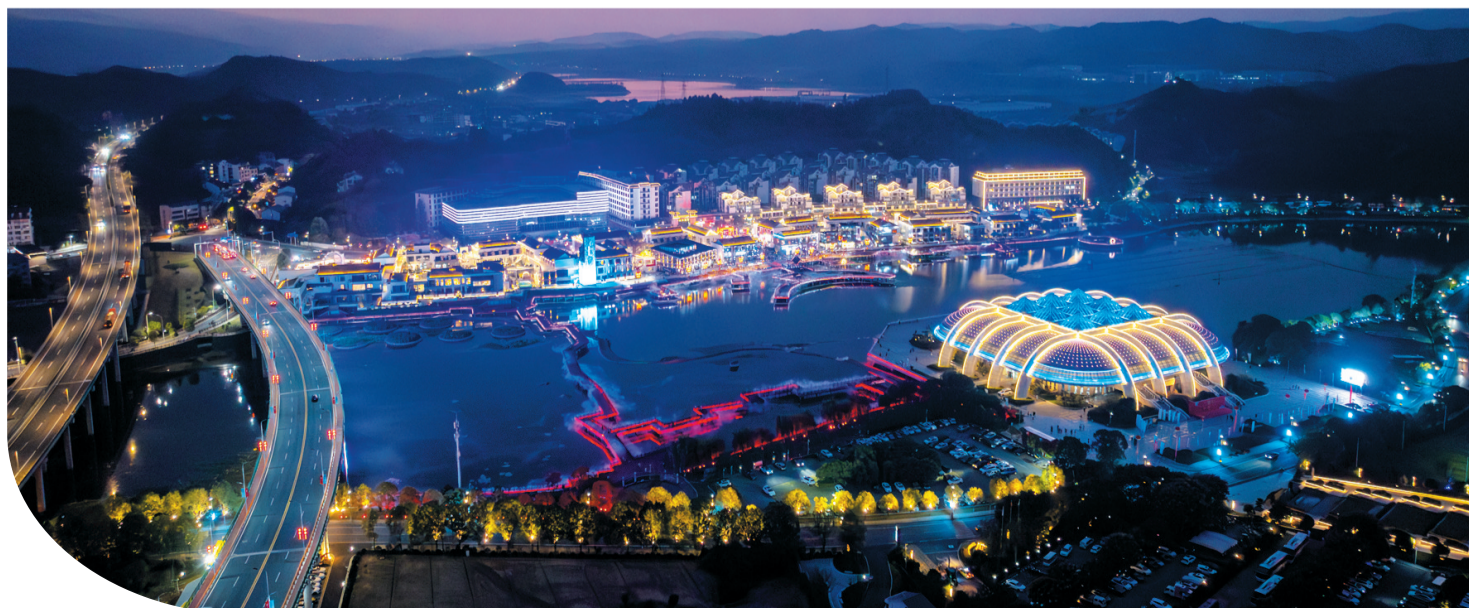
美轮美奂的“太极之夜”文旅街区。