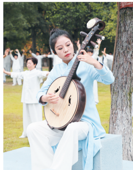
▶入场欢迎仪式分为礼乐迎宾、雅韵迎宾、太极迎宾等，融合了笙、琴、茶、棋、拳等多种太极文化元素。