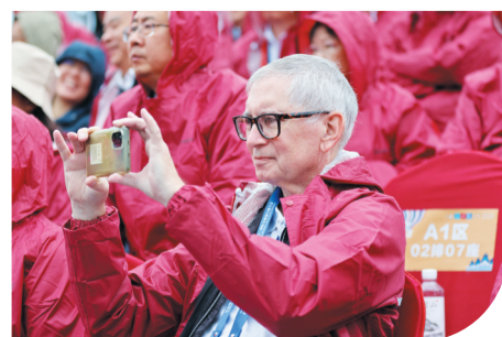
▶参加开幕式的外国友人拿出手机记录精彩瞬间。