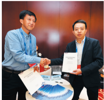
境内外旅行商对接洽谈。