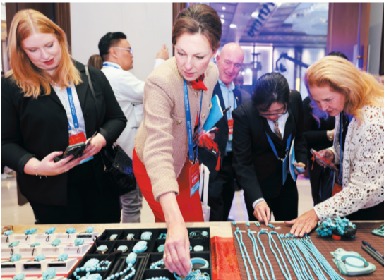
参会嘉宾欣赏湖北非遗文创产品。