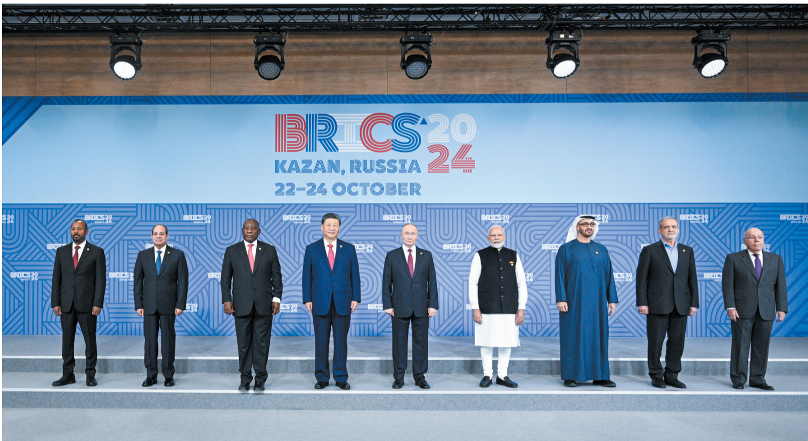
当地时间10月23日上午,金砖国家领导人第十六次会晤在喀山会展中心举行。这是会晤期间,金砖国家领导人集体合影。

新华社俄罗斯喀山10月23日电(记者倪四义 胡晓光)当地时间10月23日上午,金砖国家领导人第十六次会晤在喀山会展中心举行。俄罗斯总统普京主持会晤。中国国家主席习近平、巴西总统卢拉(线上)、埃及总统塞西、埃塞俄比亚总理阿比、印度总理莫迪、伊朗总统佩泽希齐扬、南非总统拉马福萨、阿联酋总统穆罕默德等出席。