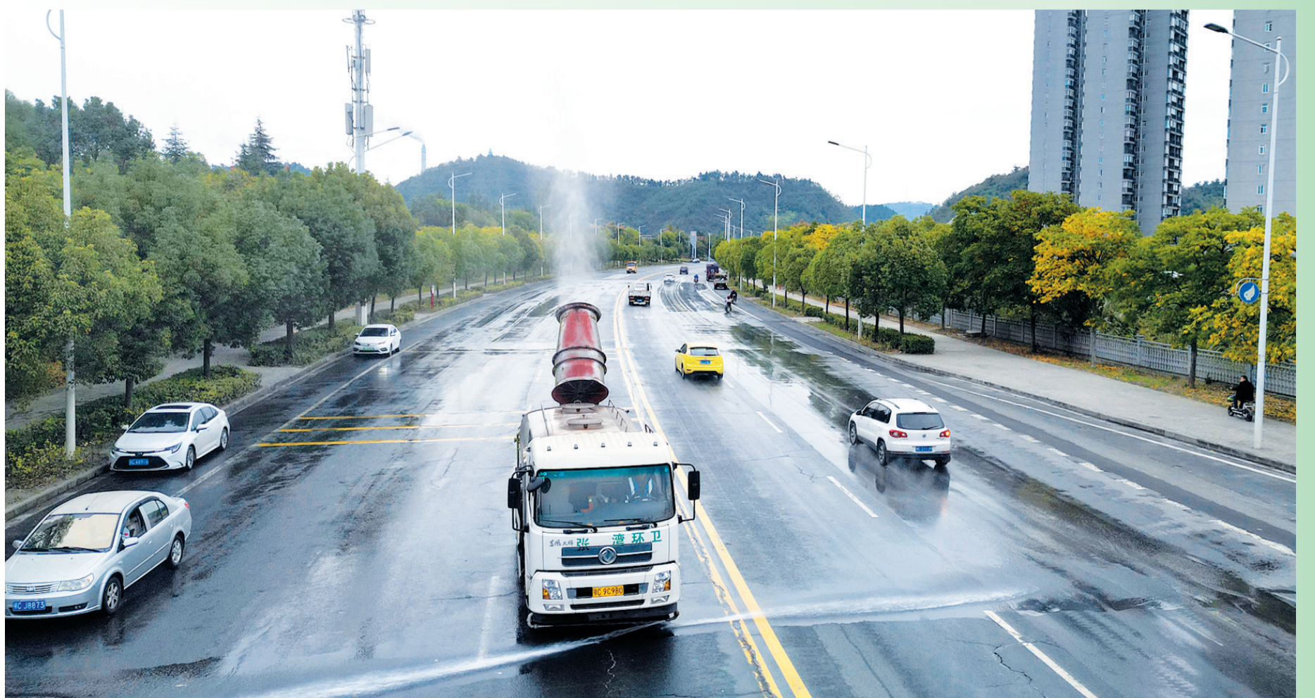
10月24日,洒水车在发展大道进行路面清洗工作。