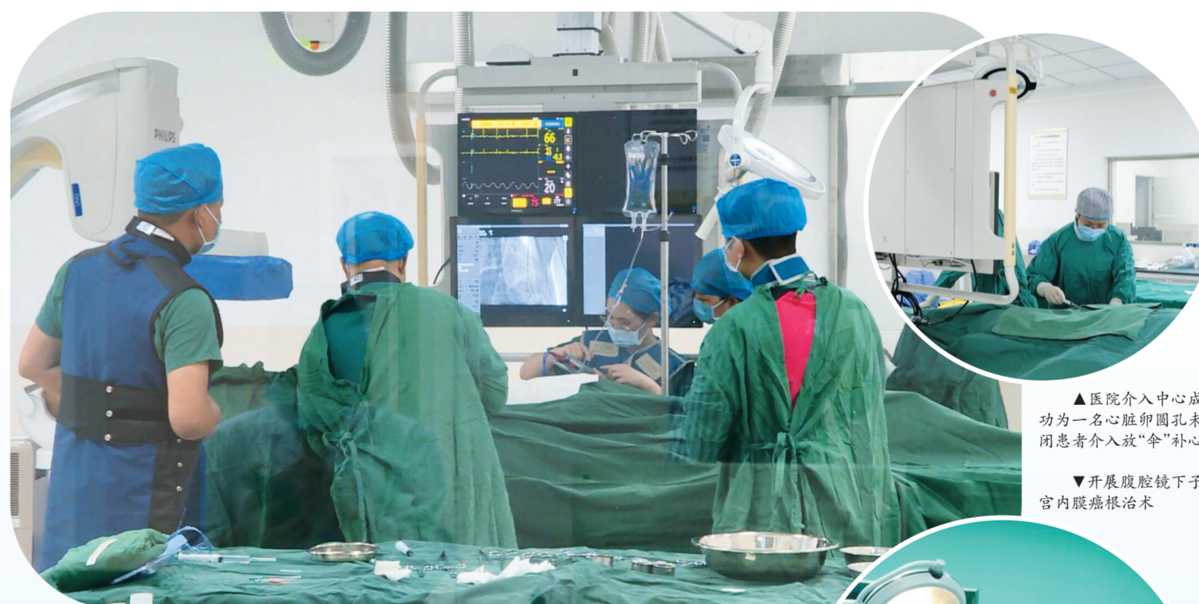
开展微创介入手术