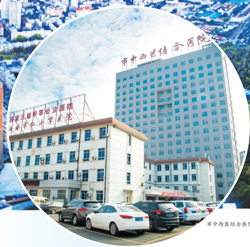
市中西医结合医院外景