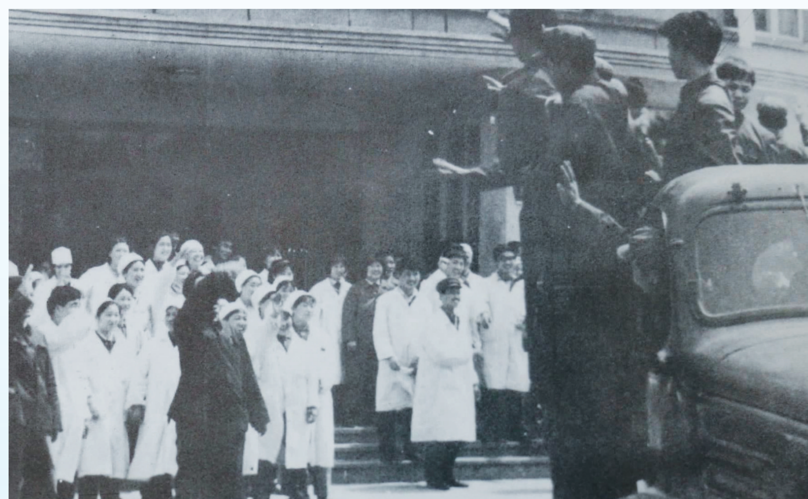
1980年4月，医院成功抢救亚硝酸盐中毒的铁道兵某部指战员。图为欢送指战员康复出院现场。

55年风雨兼程，市中西医结合医院高歌猛进，走出了一条从无到有、由弱到强的发展之路。目前，医院拥有医务人员500余人，设置40余个临床医技科室，共开放床位800张，是十堰市中医经典临床应用基地、十堰市中西医结合急腹症研究所、湖北省文明单位，也是江汉大学、湖北医药学院附属医院。