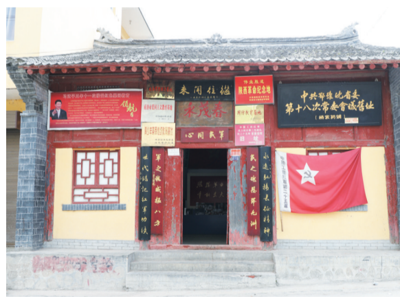
▲1935年2月19日召开的红二十五军鄂西会议旧址，位于鄂西商洛市丹凤县虎坪村涝池大院。

1934年12月20日，中共鄂豫皖省委率红二十五军由丹凤县棣花过丹江，南下竹林关。又经山阳县漫川关到湖北鄂西，然后北返沿秦岭东进，绕道商州城，再返洛南。以返回的行动，扫除民团武装和地方反动政权，熟悉了鄂豫陕边的地理民情，扩大了共产党和红军的政治影响。红军所到之处，严格执行群众纪律，镇压土豪劣绅，将没收的大批财物分给了穷苦农民。