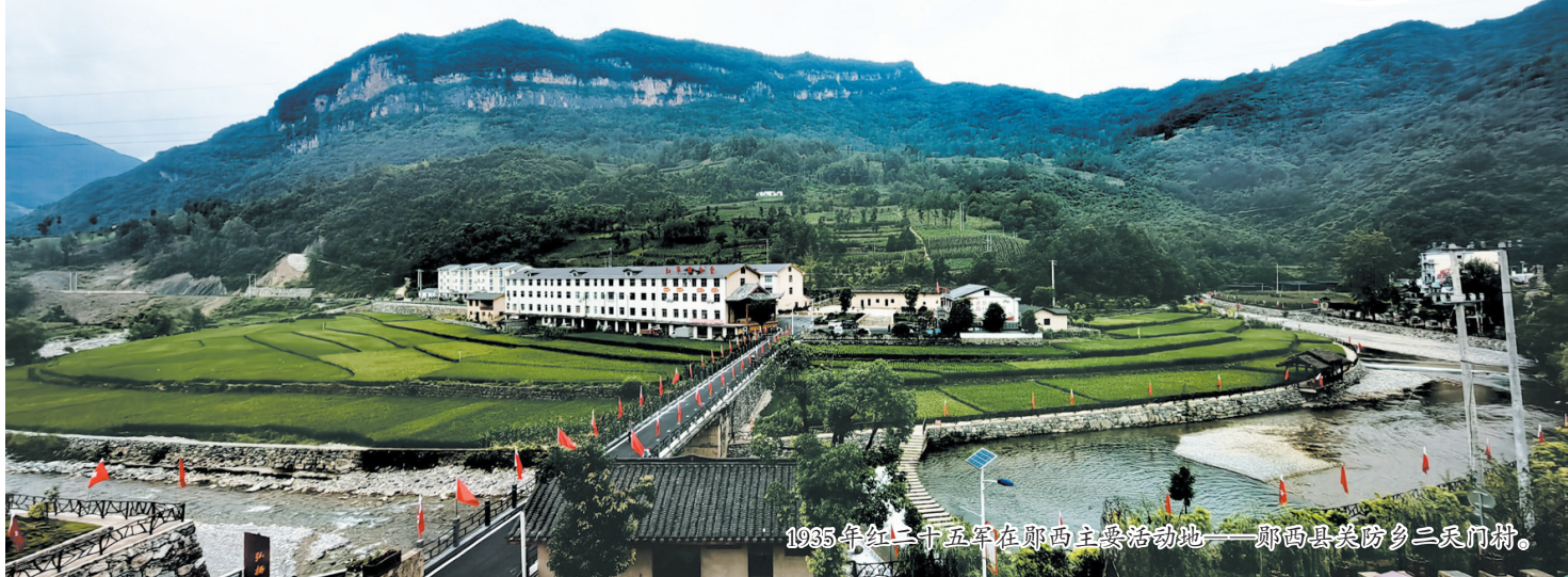
1935年红二十五军在鄂西主要活动地——鄂西商洛市丹凤县棣花镇二天门村。