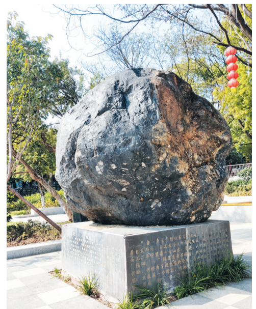
郟阳文化广场西北角放置着一块重达八吨的陨石。

综合上述证据和长篇细说，简言之，郟阳得名由“陨”而“郟”。笔者认为，郟阳名称溯源应探究郟阳历史演变的全过程，有陨石降落郟地，才有陨关之称谓，而后由陨关、郟关、郟乡县、郟县、郟阳府、十堰市郟阳区依次演变而来。