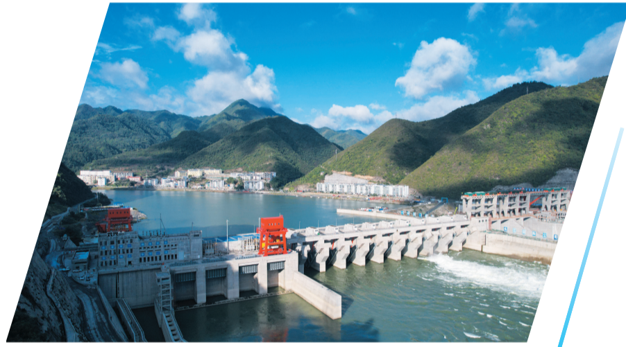
孤山航电枢纽工程

前三季度，新签约亿元以上项目56个，协议资金311.8亿元，亿元以上已开工项目26个，总金额90.31亿元……一串串喜人的数字，展现出郧西县营商环境持续向“优”前行的良好势头。