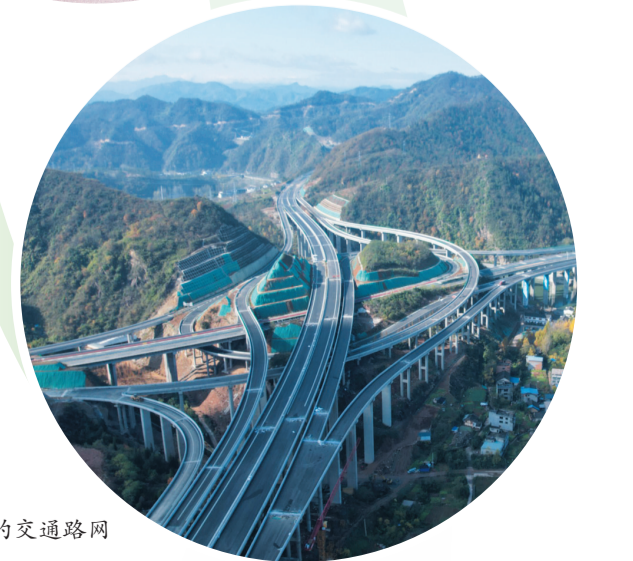
►四通八达的交通路网

郧西是一个山清水秀、风光旖旎、物华天宝、钟灵毓秀的地方。行至郧西，定有梦与美景；畅游郧西，便是诗和远方。 近年来，在市委、市政府的坚强领导下，郧西坚持以习近平新时代中国特色社会主义思想为指导，深入学习贯彻习近平总书记考察湖北重要讲话精神，认真落实省委“五个以”实践体系框架、“五个一”省级发展调控机制系列部署要求，统筹高水平保护和高质量发展，在中国式现代化湖北实践中找准定位，加快建设绿色低碳可持续发展先行区。近三年，郧西地区生产总值年均增长9%以上，规上工业总产值年均增长30%以上、地方一般公共预算收入年均增长25%以上，万元GDP能耗年均下降3个百分点以上。