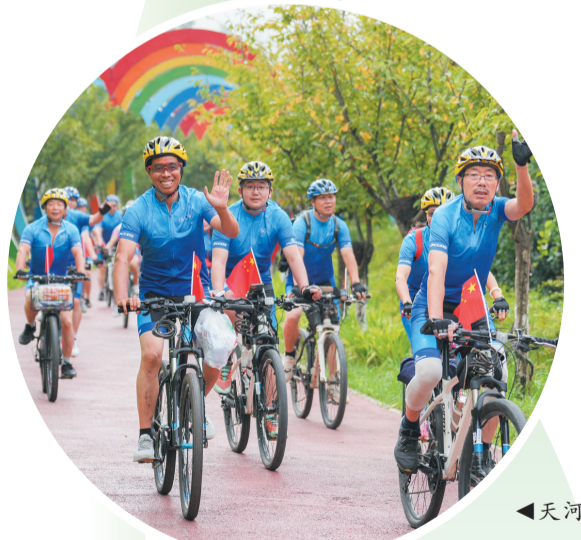
◀天河绿道自行车骑行大赛