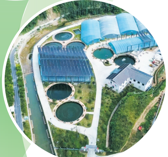
▲河夫数智渔业基地