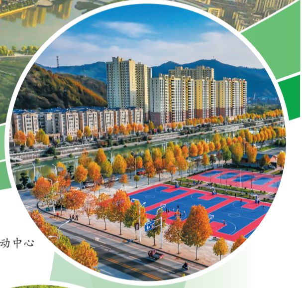
►郧西县群众户外运动中心