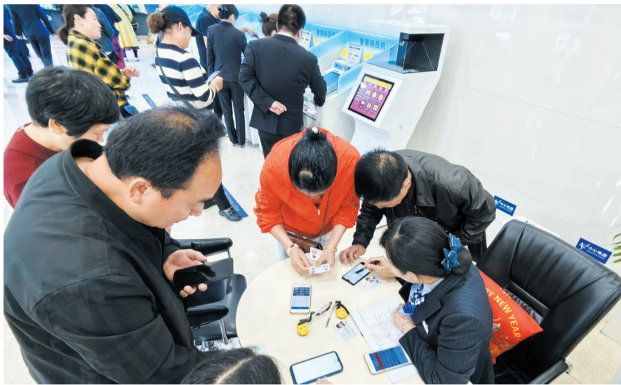
▲为群众更换第三代社保卡 ▲全市首个“省直社会保险业务服务点”在建行青少年宫支行揭牌成立

11月26日，全市首个“省直社会保险业务服务点”在中国建设银行十堰分行青少年宫支行揭牌成立。该服务点服务事项基本覆盖参保单位和个人社保所有业务种类，可满足参保单位和个人“就近办”的需求，大大提升服务质量。