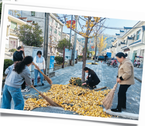
▼志愿者开展环境整治