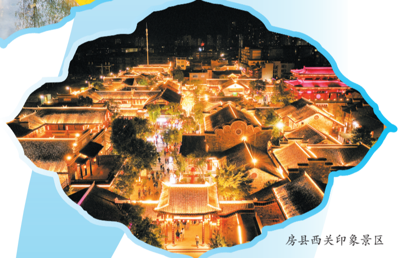
房县西关印象景区