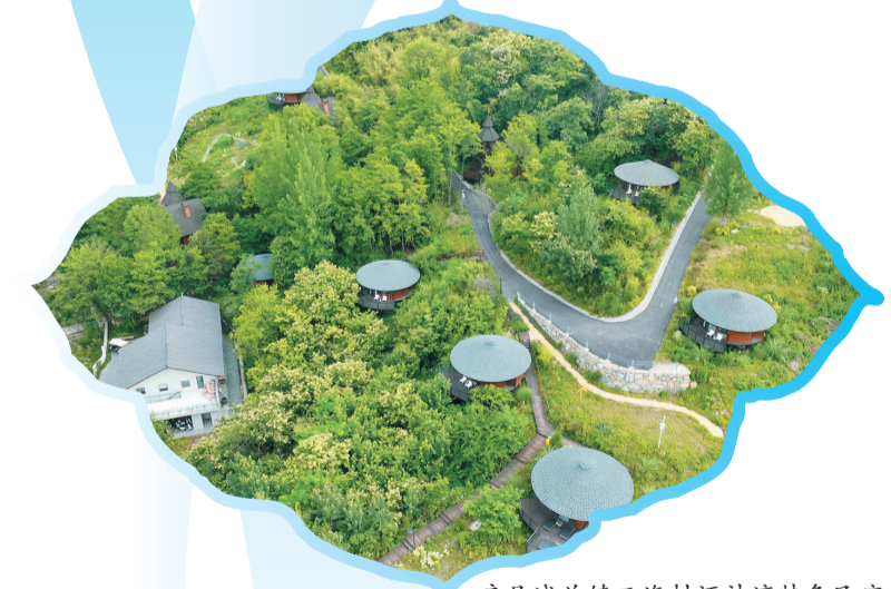
房县城关镇三海村酒神湾特色民宿

该县以人为本推进新型城镇化，释放城镇化蕴含的巨大内需潜力和增长空间，打造新的经济增长点和发展动力源，补齐民生短板，缩小城乡差距，不断提高居民的获得感、幸福感。