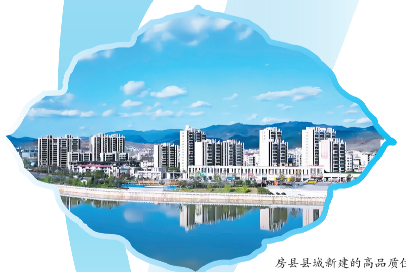
房县县城新建的高品质住宅区