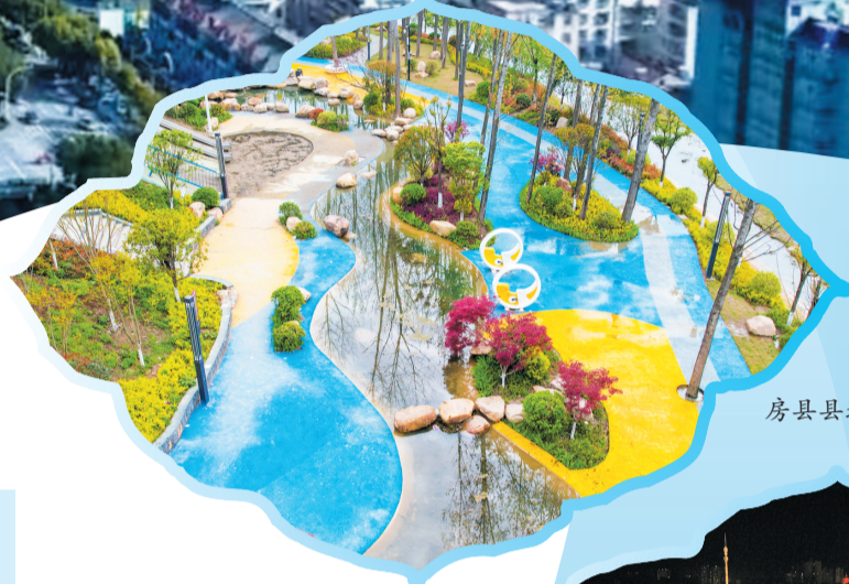
房县县城口袋公园

“一子落”带动“全盘活”，人口集聚有效激发县城活力。去年12月以来，县城累计新增人口1.5万人，城镇化率提升1.5个百分点，呈现出“出生人口止跌回升、外出人口返乡回流、房地产市场逆势回暖”的趋势。