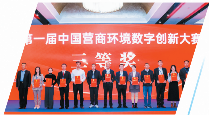
《数字赋能助力郧西县企业开办工作提质增效》案例荣获第一届中国营商环境数字创新大赛三等奖。

今年以来，积极创建“企业全生命周期一件事”改革、“政务服务增值化”改革营商环境先行区2个。