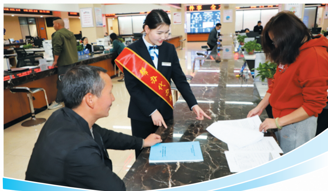
耐心指导让政务服务更有温度