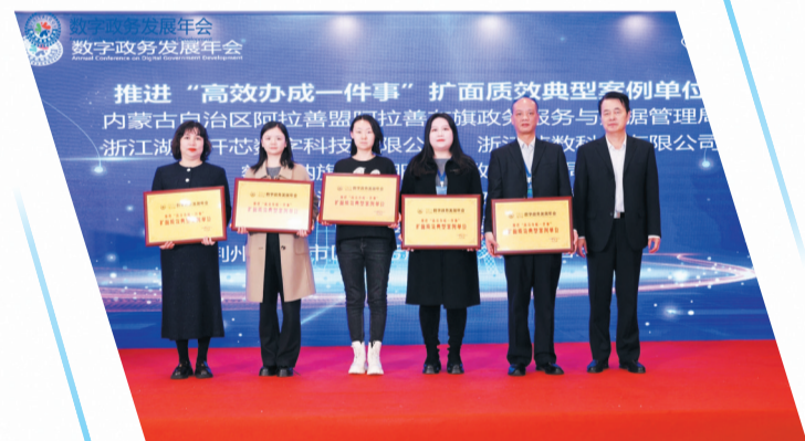
郧西县政务服务增值化改革入选全国推进“高效办成一件事”典型案例