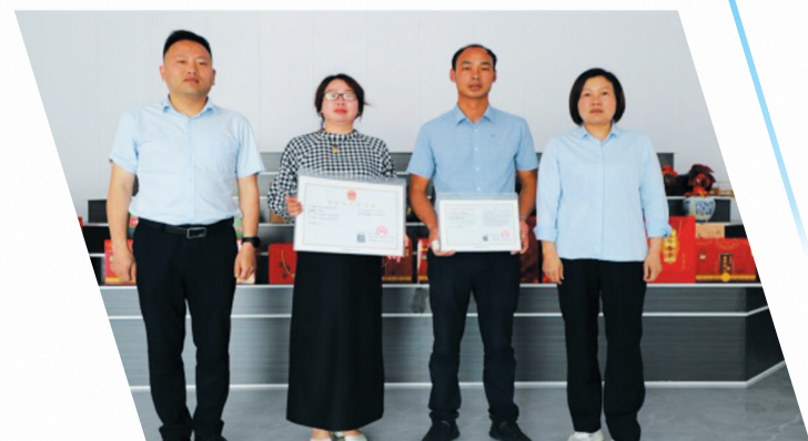
“靠前指导”+“送证上门”护航企业高质量发展。

坚持改革创新，优化政务服务，助力产业转型……目前，郧西县数据局干部职工正以强烈的责任担当为数据赋能全县经济社会高质量发展拼搏奋进。