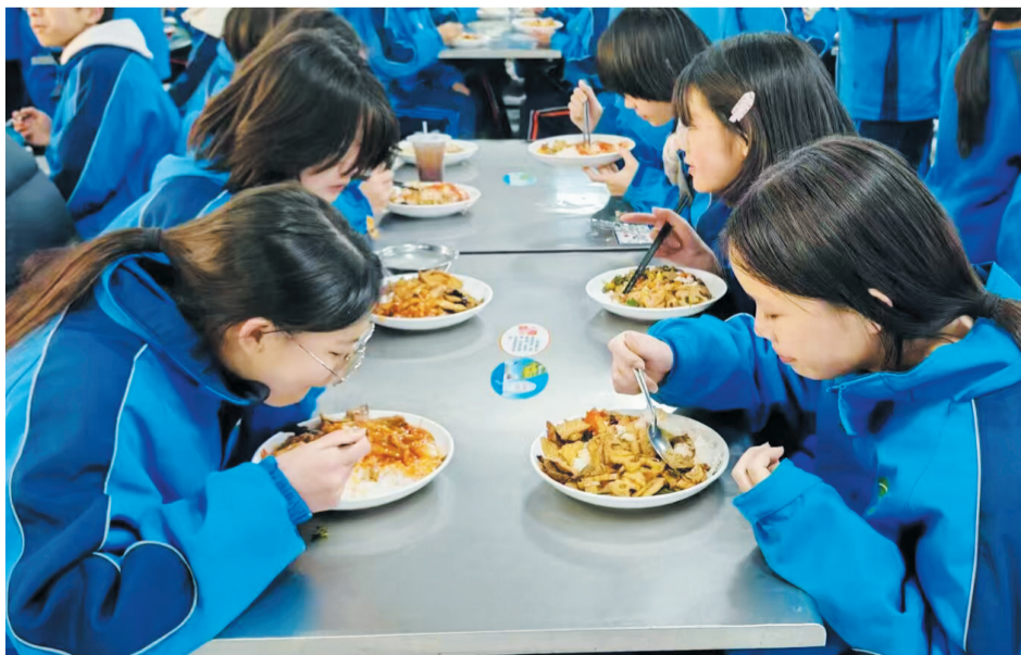
学生在食堂内有序就餐

自11月中旬省纪委监委召开中小学食堂、农村集体三资信息化监管平台建设工作部署会以来，茅箭区教育局积极响应，迅速行动，成立以局长为组长的工作专班。